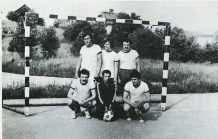
Kljub mnogim težavam so se naši „mali nogometaši“ le dobro držali...