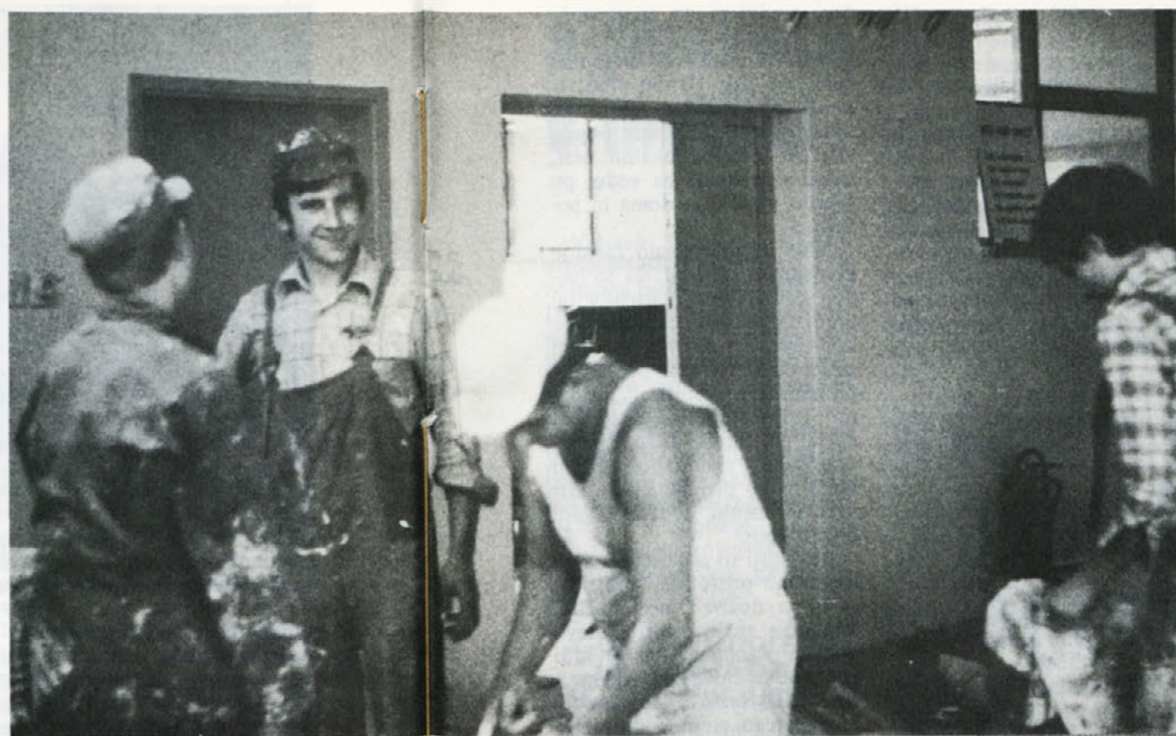
V avgustu je bilo v novomeških prostorih Laboda polno barv, lestev. Pleskarji so hiteli in notranjost se je kar vidno lepšala

V predkongresni aktivnosti so zelo na široko razpravljali tudi o vlogi in nalogah osnovne organizacije Zveze komunistov v pripravah za sprejem novih članov Zveze komunistov, pa tudi o njihovem idejnopolitičnem usposabljanju in vključevanju v delegatski sistem. Na enajstem kongresu ZKJ so glede tega zavzeli jasna stališča, ki so