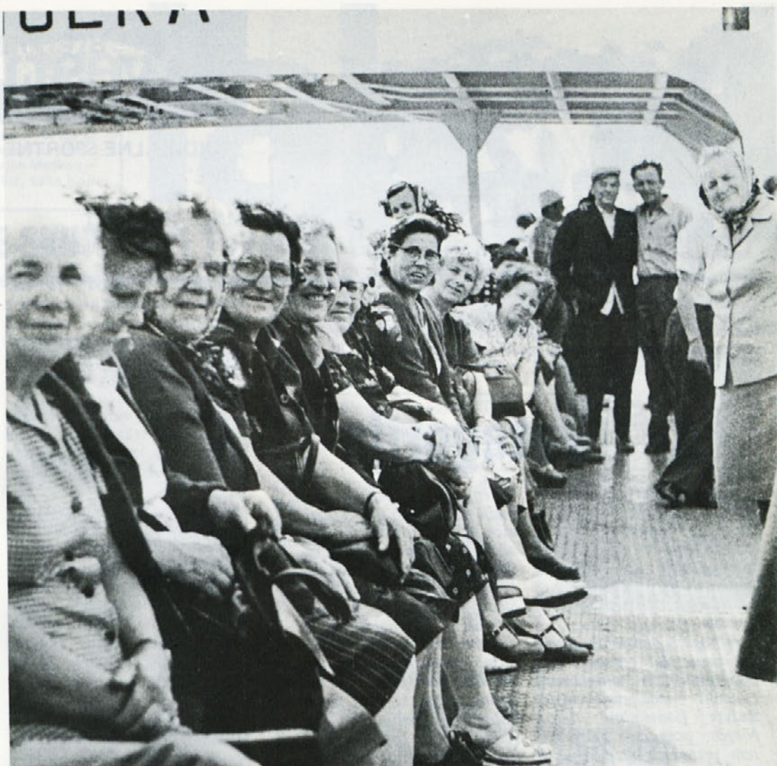
V začetku junija, ko so naše upokojenke obiskale Mali Lošinj, še ni bilo tako dolgih vrst za trajekt, kot v času kolektivnih dopustov posameznih naših TOZD

To je moderni šport v prostem času, ki ne daje nikomur prednosti in ne postavlja nobenih pogojev. Odmika se od