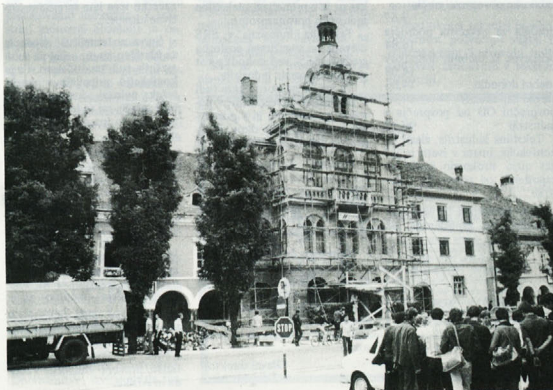
Komaj nekaj tednov nas loči od konference jugoslovanskih mest — velikega dogodka za Novo mesto. Prepleskali smo ves Glavni trg — več o tem na 7. strani!