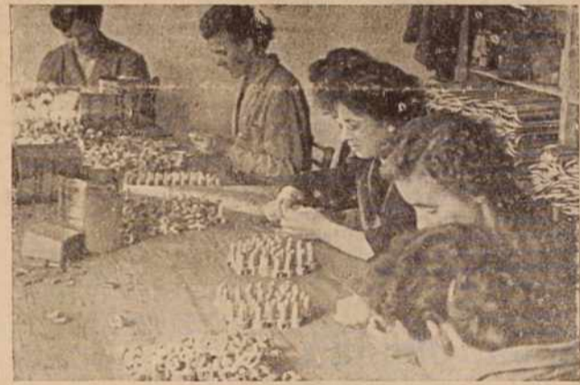
Spretno roke delavk v radgorskem Elradu — Nagrajevanje po učinku vzpodbuja

Odborniki obeh zborov so na skupni seji razpravljali o poročilu sveta za urbanizem in komunalne zadeve ter o nekaterih tekočih zadevah. Na ločenih sejah je zbor proizvajalcev sprejel posebno priporočilo občinskemu zborom proizvajalcev glede vzpodbudnejših oblik nagrajevanja v gospodarskih organizacijah.