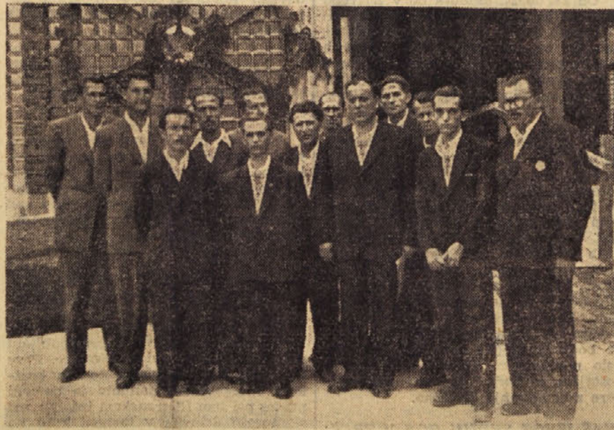
Upravni odbor Steklarne Hrastnik z gosti ob prevzemu tovarne

Tovarna stekla v Hrastniku pošilja svoje produkte tudi v tujino, s čimer si ustvarja dragocene devize, saj proizvaja tovarna danes poleg starih steklarskih izdelkov nove produkte, tako n. pr. stekla za avionske kompasne, sferna ogledala za kamione, stekla za ribiške svetilke, dvobarvne optične leče ter stekla za signale. Vrsta raznih novih izdelkov, doseganje proizvodnih nalog ter pozornost pri zboljšanju kakovosti steklenih izdelkov po temu zavednemu hrastniškemu kolektivu, ki dela sedaj že za drugo petletko, omogočila tudi v prihodnje nemoteno obratovanje in napredek tudi v pogojih novega finančnega gospodarjenja.