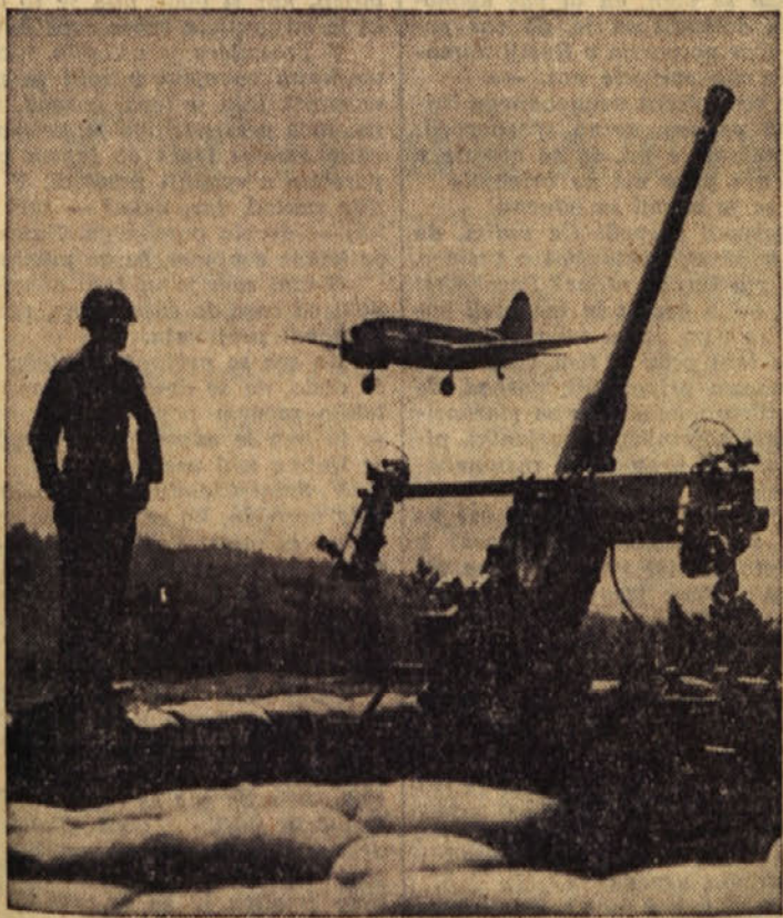
Na Koreji še vedno ni miru. Gornja slika prikazuje ameriškega vojaka na nočni straži ob protiletalskem topu.