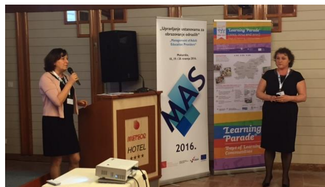
informacij o dogodku je na voljo na spletni strani .

Četrti mednarodni andragoški simpozij so od 18. do 20. aprila v Makarski na Hrvaškem s skupnimi močmi organizirale podporne službe za EPAL iz Hrvaške, Bosne in Hercegovine ter Slovenije. Dogodek je nosil naslov Upravljanje izvajalcev izobraževanja odraslih in je združeval različne akterje v regiji. Na simpoziju smo predstavili projekte EPUO iz sodelujočih držav, slovenski predstavniki pa smo prikazali tudi uspešno sodelovanje med nacionalnim koordinatorjem in lokalnim izvajalcem izobraževanja odraslih, in sicer med ACS ter Ljudsko univerzo Slovenska Bistrica na primeru organiziranja Parade učenje. Več