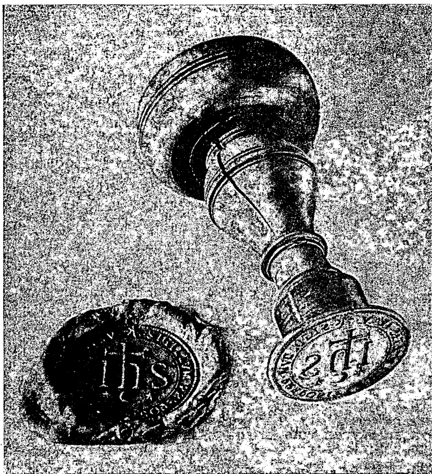
Slika 6: Pečatnik in pečat generala jezuitskega reda