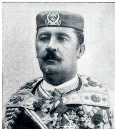
GENERAL JANKO VUKOTIĆ.

Sedel je na kamen. Zadnji žarek solnca je obseval Helenino lice, ko je pojasnjevala: „Sammo velika ljubezen je zmožna žrtve. Ko si se bil poslovil oni dan tako razburjen od mene, se me je lotil strah. Kaj je časna sreča, časno trpljenje, napram slavi, katero uživajo izvoljeni vekomaj? Da bi zapustila