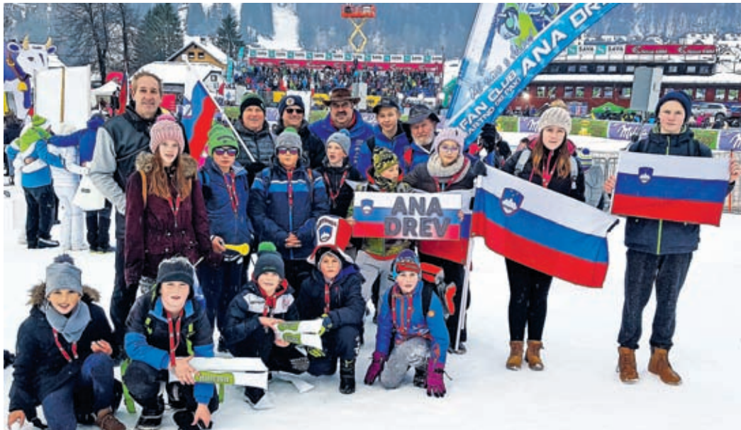
Podmladek navijaške skupine v Kranjski Gori