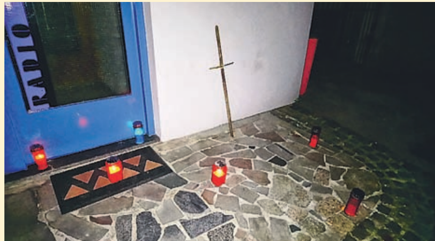
Nekateri naši poslušalci so ukinitve programa SNOP vzeli zelo prizadeto, čeprav smo se med radijskimi postajami od njega poslovili zadnji. Nekdo najbolj užalosten pa je našo jutranjo ekipo presenetil s turbno popotnico v studijske prostore.

upanje, da morda v prihodnosti še najdemo podobno pot. Iz studija Radia Velenje seveda tudi zdaj pripravljamo nočni program, ki pa ne poteka v živo, je pa kljub temu bogat z razpoloženo glasbo.