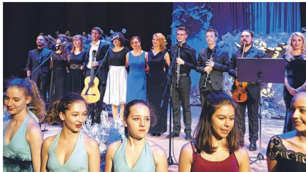
Program so pripravili vrhunski domači ustvarjalci