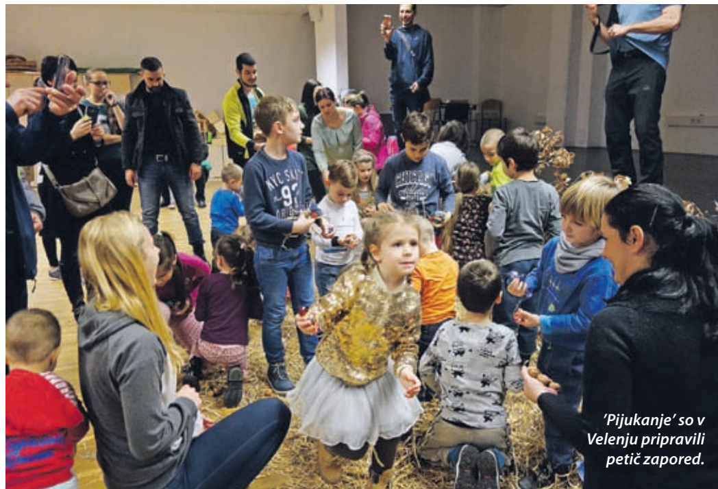
'Pijukanje' so v Velenju pripravili petič zapored.

Srbsko društvo dr. Mladen Stojanović v Velenju organiziralo 'pijukanje'