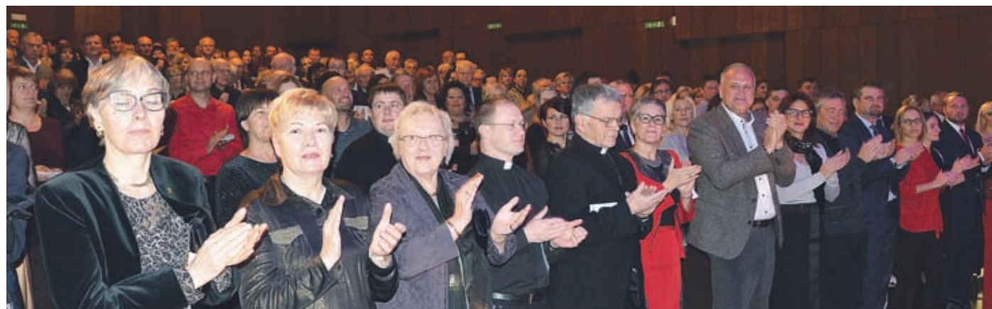
Ustvarjalci programa so navdušili prisotne v povsem napolnjeni dvorani