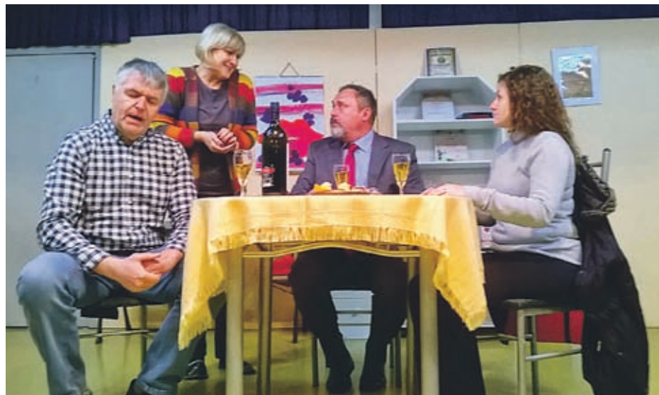
Dobro uigrana ekipa gledališke sekcije šentiljskega kulturnoprosvetnega društva bo komedijo Za nacionalni interes najprej uprizorila na domačem odru, veselijo pa se tudi gostovanj drugje.

Deseterici stalnih članov, ki so vsi amaterji, izobražujejo pa se na raznih seminarjih, se