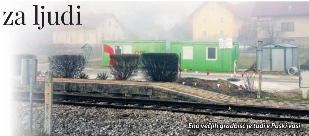
Eno večjih gradbišč je tudi v Paški vasi

drugega predstavljajo manjše akcije, pri izvedbi katerih občina sodeluje tako, da zagotovi potrebne materiale, dela pa opravijo krajani sami (urejanje bankin, vodotokov, odvodnjavanje, manjše urejanje komunalne infrastrukture, nameščanje urbane opreme, sodelujejo pri postavitvi in ureditvi ekoloških otokov za zbiranje odpadkov, opozarjanje na ureditev varnosti udeležencev v prometu, pešpoti na določenih odsekih, postavitev prometne signalizacije), različne oblike druženja za svoje krajanje (izleti, pikniki, pohodi ...) ter vzdrževanje oziroma skrb za objekte, prostore in športne površine, ki jih upravljajo in si v sodelovanju z občino prizadevajo, da ti služijo