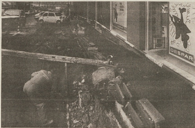
Pred veleblagovnico Despar v Rojanu je počila cev vodovoda, ki ga vidimo na sliki. Dvignil se je vodni curek, ki je segel do tretjega nadstropja.