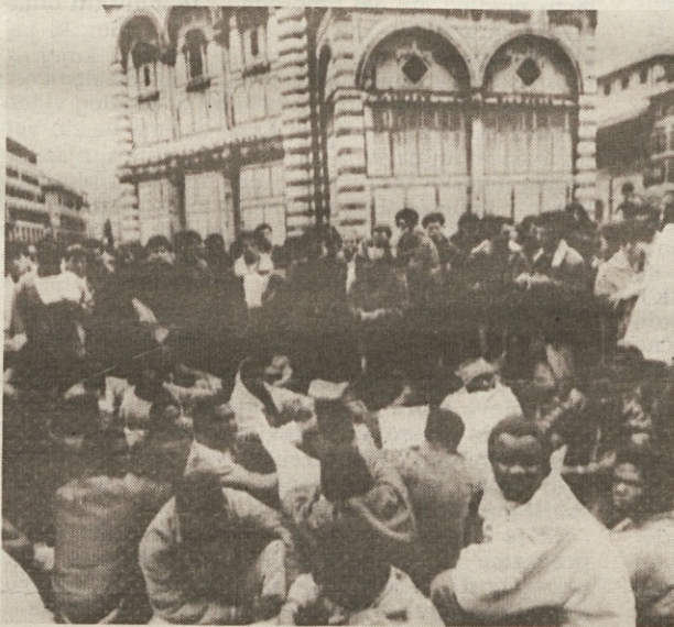
Senegalski krošnjarji nadaljujejo protestni sit-in v Firencah

FIRENCE — Na procelju slavnega florentinskega Palazzo Vecchio je včeraj zjutraj visel transparent na katerem je pisalo, da so zasedli občinski svet. Z zasedbo dvorane s strani nekaterih zastopnikov občinske politične opozicije se je zaključila morda prva italijanska politična kriza z rasističnim priokusom.