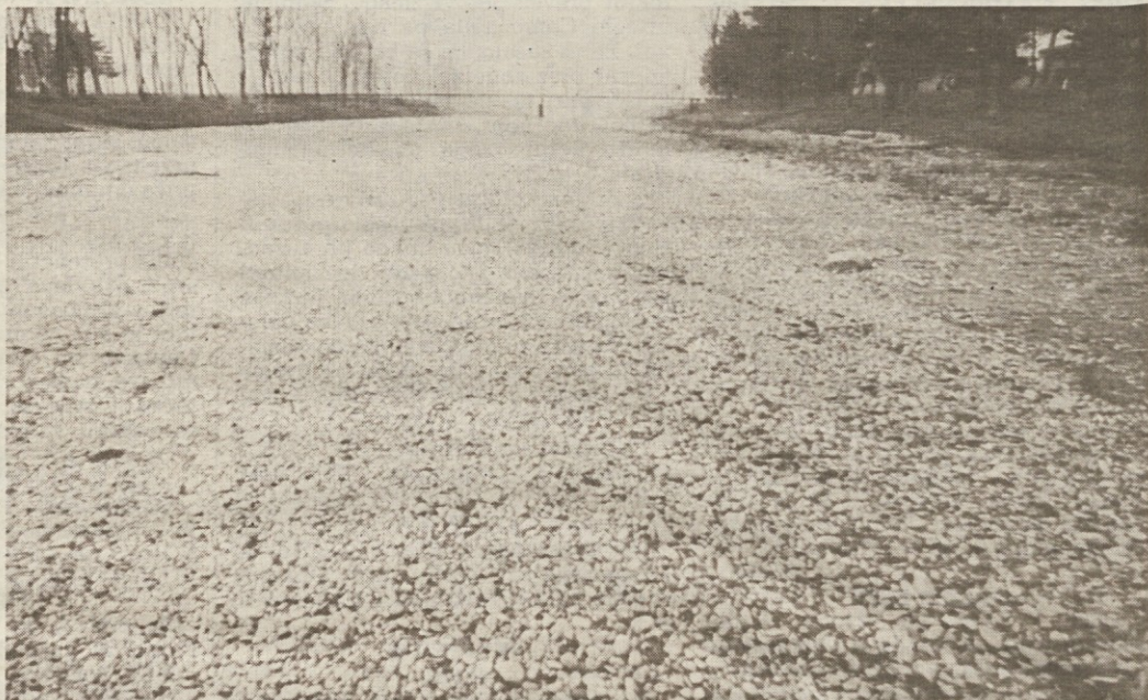
Slika ni posnetek nove avtomobilske trase temveč struga nekega pritoka reke Reno v Romagni (AP)

Cristofori trdi, da položaj ni dramatičen, a tega je bolje, da osebno ne pove kmetom. Confcoltivatori je včeraj jasno poudarila, da v Italiji ne smemo več suše obravnavati kot izreden pojav, ki smo mu lahko kos z izrednimi ukrepi. Po dveh letih bi moraló biti vsakomur jasno, da prihaja do pravih klimatskih sprememb, tako da jim z mašili ne bomo kos. Z izrednimi ukrepi bodo lahko omilili povpraševanje po pitni vodi, ne morejo pa poskrbeti za kmetijstvo. Confcoltivatori trdi, da je že leta 1982 predlagala ustanovitev ministrstva za vodno bogastvo, ki bi združil vse pristojnosti v enih rokah. Po njenem je že sedaj položaj v raznih deželah dramatičen in se bo lahko v prihodnjih tednih še poslabšal, če ne bo prišlo do izdatnih padavin. Teh pa po vsem sodeč še ne bo, zaradi pomanjkanja snega pa se povsod niža višina podtalnice, da bodo vodovodi kaj kmalu zajemali oporečno vodo.