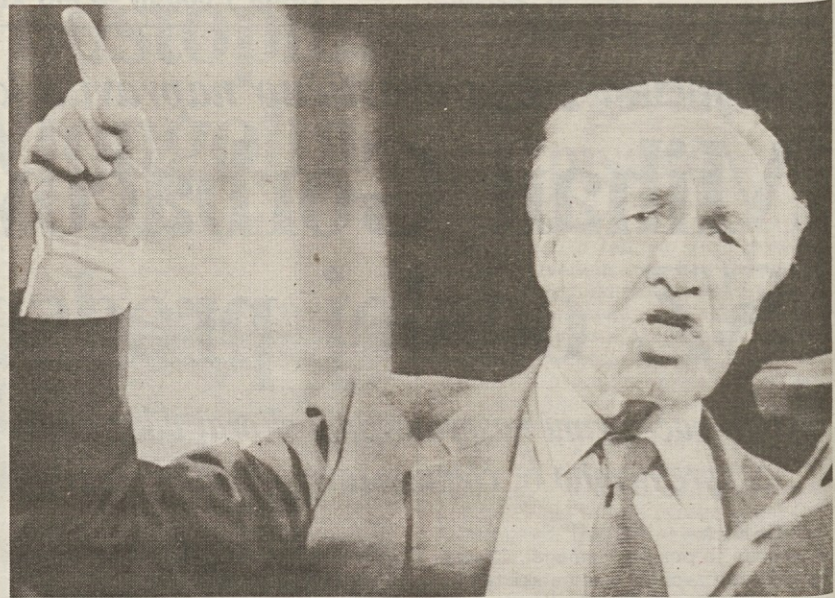
Namestnik premiera Peres, ki ga je Šamir razrešil vladne funkcije