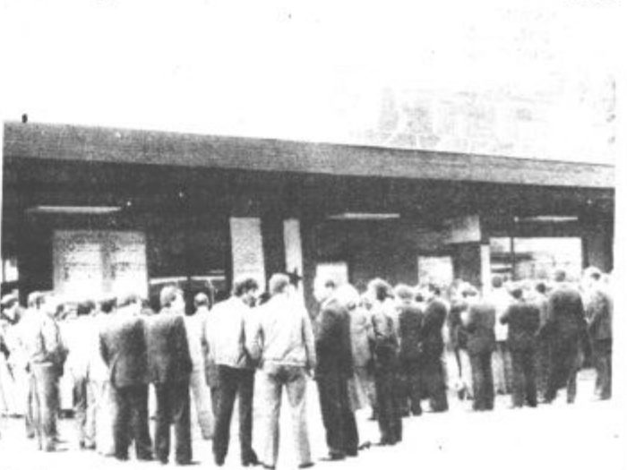
Novi avtobusni prostori so za potnike, kakor tudi za delavce Izletnika, izrednega pomena.