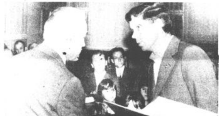
Na slavnostni seji so podelili plakete in priznanja krajevnih skupnosti. S komemoracijo so se spomnili padlih žrtev sovražnikovega divjanja.