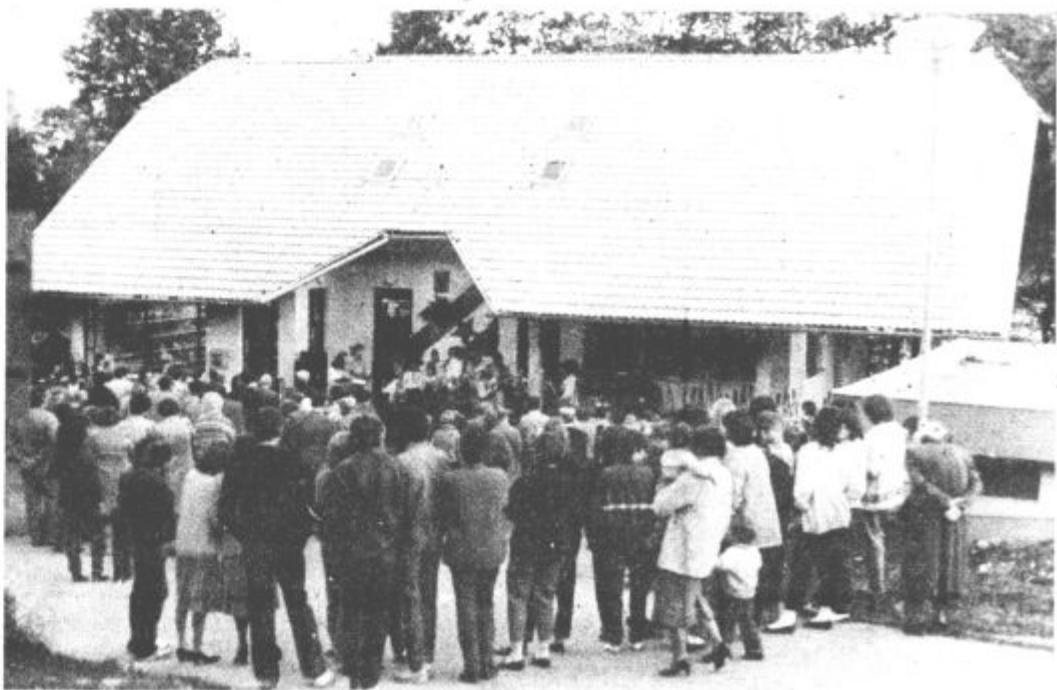
Dom je nov in lep. Od krajanov samih pa je odvisno kakšna bo njegova vsebina.