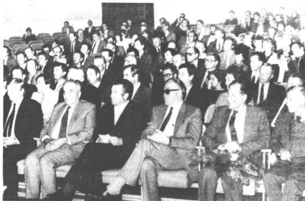
Delegati in gostje med slavnostnim zasedanjem občinske skupščine

„Mnogo je med nami posameznikov, ki vsakodnevno poleg svojega rednega dela neutrudno ustvarjajo in na različnih področjih prispevajo kulturnemu, gospodarskemu, in samoupravnemu razvoju posameznih področij in