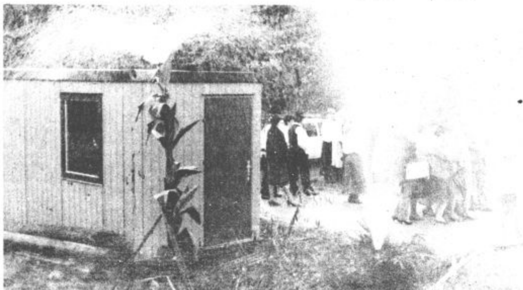
Dovolj vode za vsa gospodinjstva in tudi za bodoče krajanje

S to pomembno delovno zmago so se tudi krajanje krajevnih skupnosti Gorenje vključili v praznovanje letošnjega občinskega praznika.