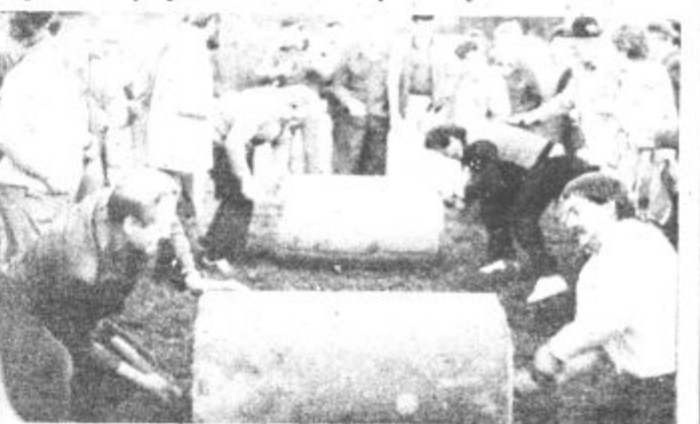
Pri razbijanju betonskih cevi je bila najboljša Žarova, druga Za gradom, tretji je bil Stari trg in zadnja Partizanska.

milijonov dinarjev, v razliko med dejanskimi stroški in vrednostjo projekta pa sodijo neevidentirana dela, iznajdljivost, inovacije in organizacijski učinki posameznikov, ki so bili v ospredju izvajanja toplifikacije.