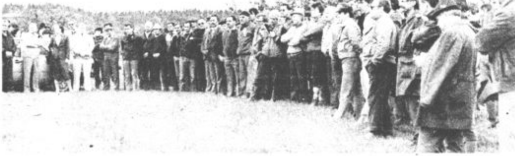
Starešine in drugi udeleženci občinskega tekmovanja so pozorno prislubniti govoru in kulturnim utrinkom