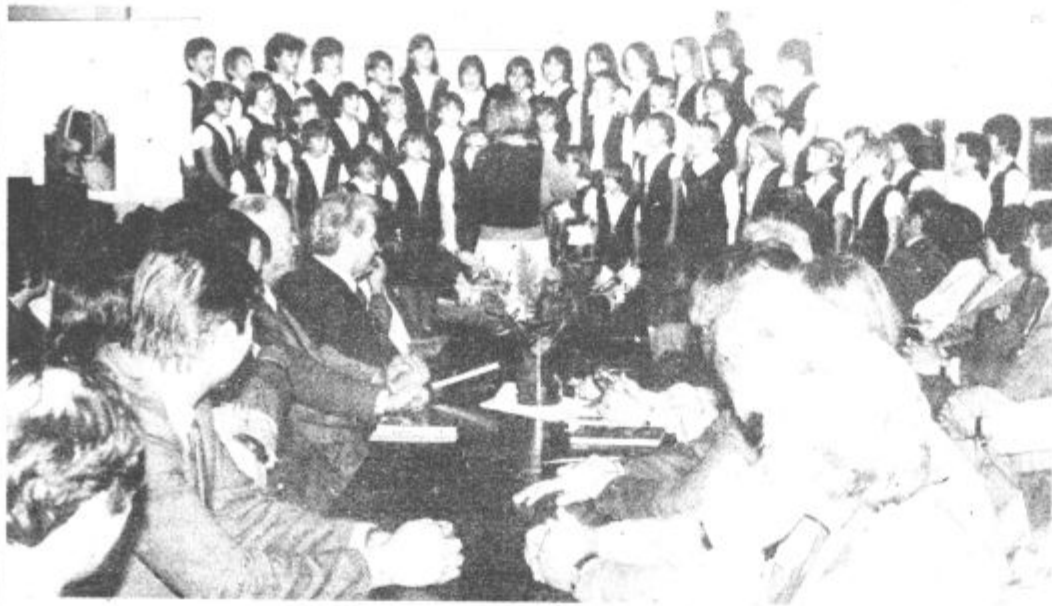
Med predstavitvijo nove knjige

dinske organizacije. S skupnimi močmi je treba narediti vse, da bo varčevalna kultura prerastla v splošno družbeno moralni odnos vseh mladih za ustvarjanje boljših možnosti za življenje, za delo in samoupravljanje.