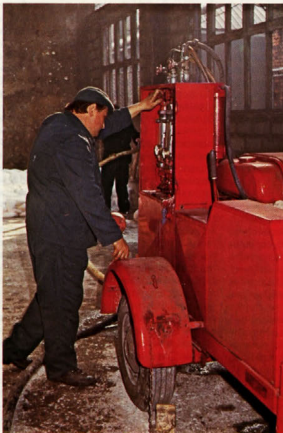
Ob rob razpravi in sprejemanju ZR Cinkarne za 1981 leto

ka. Navedeno fazo nismo uspešno opravili zaradi časovne stiske in manjkajočih analiz, kar se nam je v nadaljevanju planiranja negativno obrestovalo. Pred začetkom planiranja moramo prav tako poznati stanje koriščenja zmogljivosti. To področje je pomemben element aktiviranja notranjih rezerv in možnosti zmanjšanja stalnih stroškov na enoto proizvoda. Prav tako je