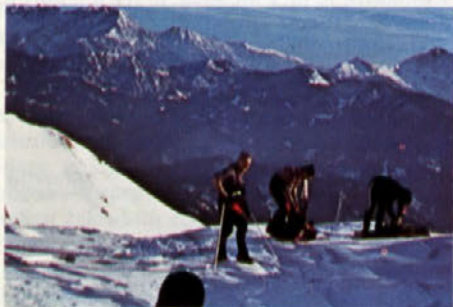
Januar na vrhu Košute

Tistega dne sem vstal okrog tretje ure zjutraj, si pripravil čaj za popotnico, tudi kavi se nisem odpovedal. V svojo popotno omaro sem vrgel nekaj za pod zob, ostale planinske rekvizite sem si pripravil že prejšnji večer. Ob štirih zjutraj sem vrgel svojo omaro v železnega gamsa, vanj spravil svoje kosti, prijel za plastično rogo-vje in dal gas proti Logarski. Spotoma sem večkrat pogledal skozi veke svojega gamsa, da bi ugotovil, kakšno bo vreme. Pa ni obetalo najbolje. Upal sem na najboljše in moji klikerji so se že sprehajali po Raduhi. Vožnja je kar hitro minila in z gamsom sva se znašla na Križišču, kjer se pot odcepi na Robanov kot. Malo nižje, v Belši, sem spravil svojega gamsa s ceste in malo pokramljal s kmetom, na čigar zemlji sem ga pustil. Nato sem naložil omaro na svoje kosti ter prečkal Savinjo. Samotaril sem navkreber po gozdu, gledal na vse strani in občudoval macesen ter ga v mislih že videl spremenjenega v ladijski pod, ki bi mi krasil stanovanje. Iz teh iluzij me je predramil starejši lovec, ki je prihajal po lovski poti. Sledil je prisrčen jutranji pozdrav in še kakih deset minut skupne hoje. Pogovor je tekel o vremenu, in tudi lovec ni imel dosti zaupanja vanj. Zvedel sem tudi, da sledi kozi. Na bližnjem križišču sva si zaželela obilo sreče, lovcu dober ulov, meni pa nadaljnjo turo.