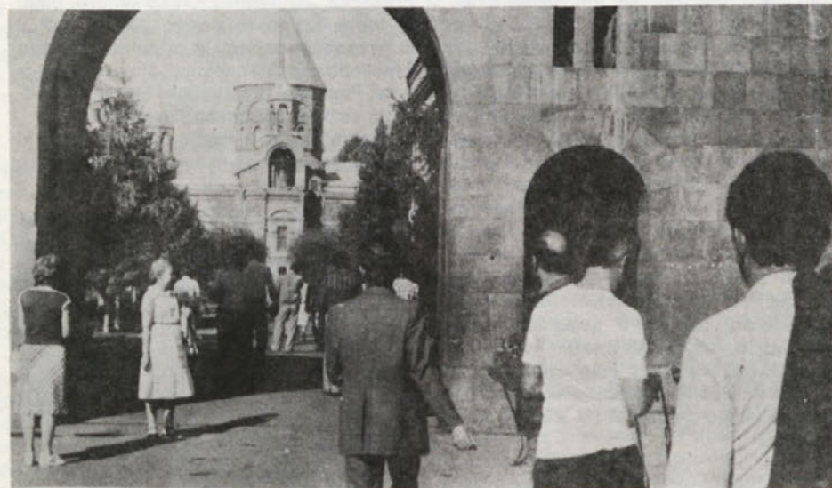
Središče Armencev Etšmeatzir