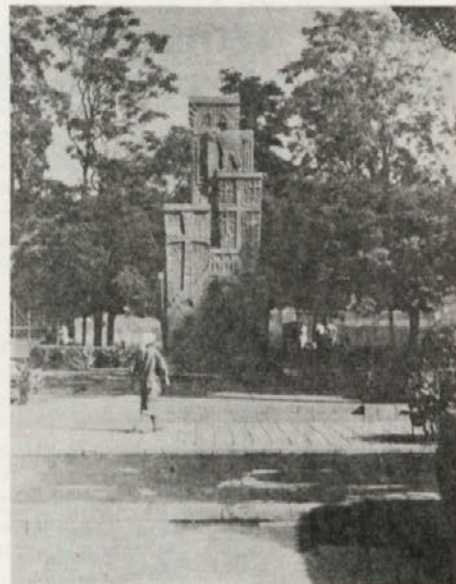
Še en spomenik v spomin genocida.