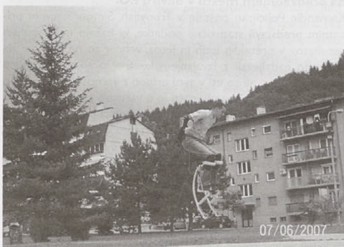
Vragolije v mestnem parku v Trbovljah

Prav zaradi tega lastnik podjetja razmišlja o ustanovitvi športnega društva, ki bi k tej športni panogi pritegnilo še več mladine. Tako bi lahko mladi izkoristili svoj prosti čas in svoje prve poskoke preizkusili v prostorih telovadnice ter se naučili osnovnih veščin. Ob dobrem treningu in vsakodnevnih vajah pa se da s powerizerjem skočiti tudi do dva metra v višino in tri metre v daljino, najboljši pa lahko z njim pre-