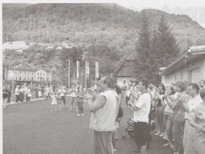
Hrastničani v pričakovanju svojega junaka