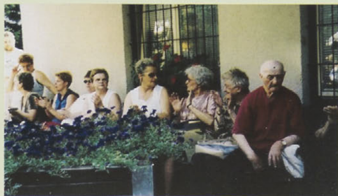
...in sodelavci in obiskovalci