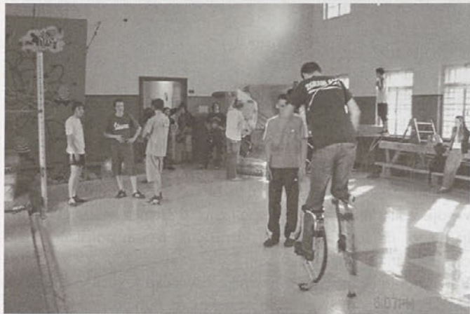
Poskusni poskoki v telovadnici Partizan

V zadnjih tednih je pozornost občanov pritegnilo v naših krajih še ne videno poskakovanje. Očitno se tudi v Trbovlje seli priljubljen adrenalinski šport, za katerega poleg spretnosti in dobre telesne kondicije potrebuje te powerizer oz. t.i. skakače.