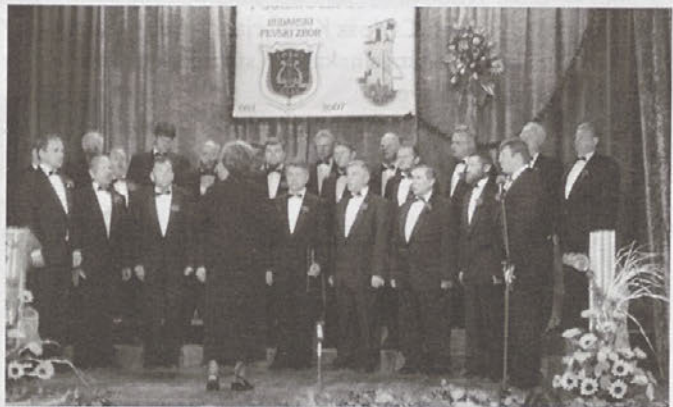
Loški glas se je pokazal v najlepši luči