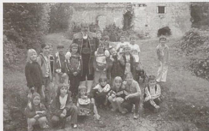
Po Valvazorjevih poteh

Lasten kruhek je vsem zelo teknil. V sredo so pohajkovali po Valvazorjevih poteh. Ogledali so si Valvazorjev izvir v Medijskih toplicah in spoznavali zgodovino kraja.