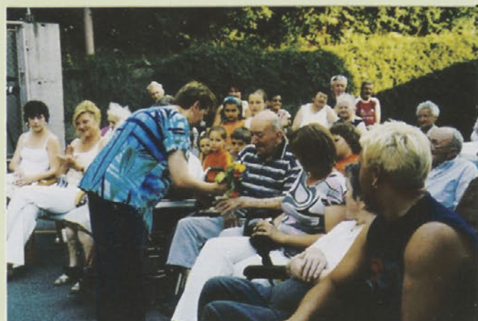
...in veseli stanovalci...