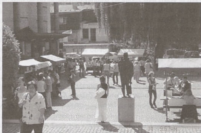
1. zasavski zaposlitveni sejem pred trboveljskim DD

Trboveljska Območna služba ZRSZ je v četrtek, 14. junija 2007, organizirala prvi zasavski zaposlitveni sejem, ki se je odvijal na parkirišču in v osrednji avli Delavskega doma v Trbovljah. Na sejem je bilo vabljenih 1261 brezposelnih oseb, kar je okrog 45 % vseh brezposelnih v regiji.