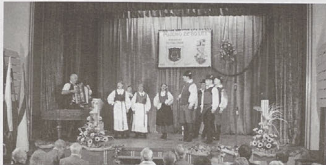
Odmor med prvim in drugim delom koncerta je popestrila folklorna skupina trboveljske Svobode