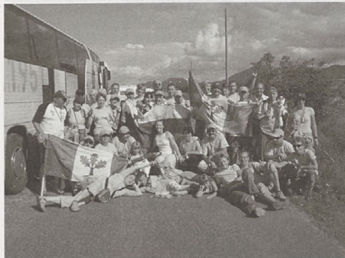
»Gasilska« Brodarskega društva Hrastnik