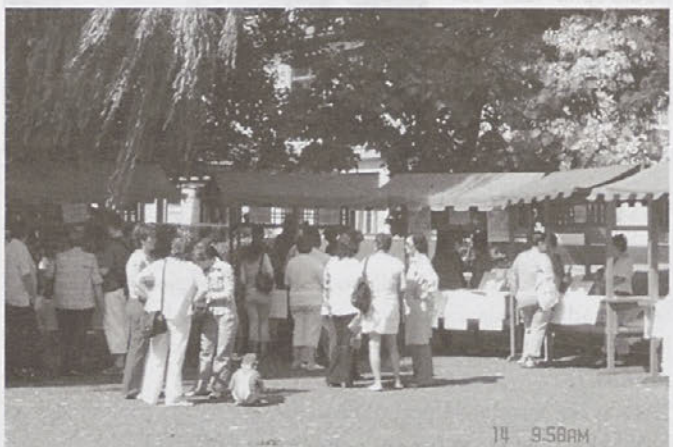
Obiskovalci so bili radovedni

Prosta delovna mesta je predstavljalo 28 delodajalcev, med njimi tudi štirje s sedežem izven Zasavja (Ljubljana, Kranj, Straža pri Novem mestu, Ivančna Gorica). Podjetja so iskala predvsem poklice strojne, elektro, grafične, lesarske ali druge tehniške smeri. Ponudba prostih delovnih mest je bila torej bolj zanimiva za moško populacijo (lesni tehniki, CNC programerji, upravljavci strojev, ipd.), čeprav je bilo med vabljenimi brezposelnimi osebami kar 55 % žensk. Z Območne službe ZRSZ Trbovlje sicer sporočajo, da so na zaposlitveni sejem vabili neposredno zaposljivo populacijo iskalcev zaposlitve, ki je v širšem smislu ustrezala profilom, ki so jih predstavljali delodajalci. Kolikšen odstotek vabljenih je dejansko ustrezal zahtevam delodajalcev, pa zaenkrat še ni znano.