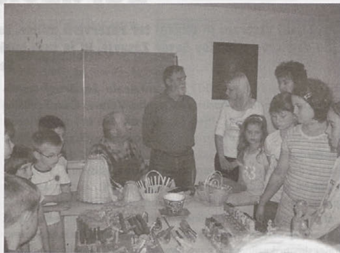
Rezbarimo in pletemo iz šibja