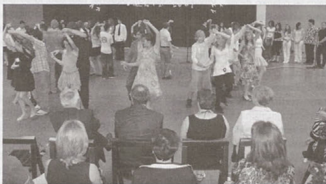
Dolani so zaplesali

V športno dvorano na Logu so povabili starše in za začetek pokazali, kako se znajo zavrteti. Nekaj tednov so se namreč posvečali učenju standardnih in modernih plesov. Sledile so hudomušne domislice na račun sošolcev in razrednikov, ki so jih v teh letih »dobili v roke«, tem pa priznanja šole, ki temeljijo na uspehih raznih tekmovanj.