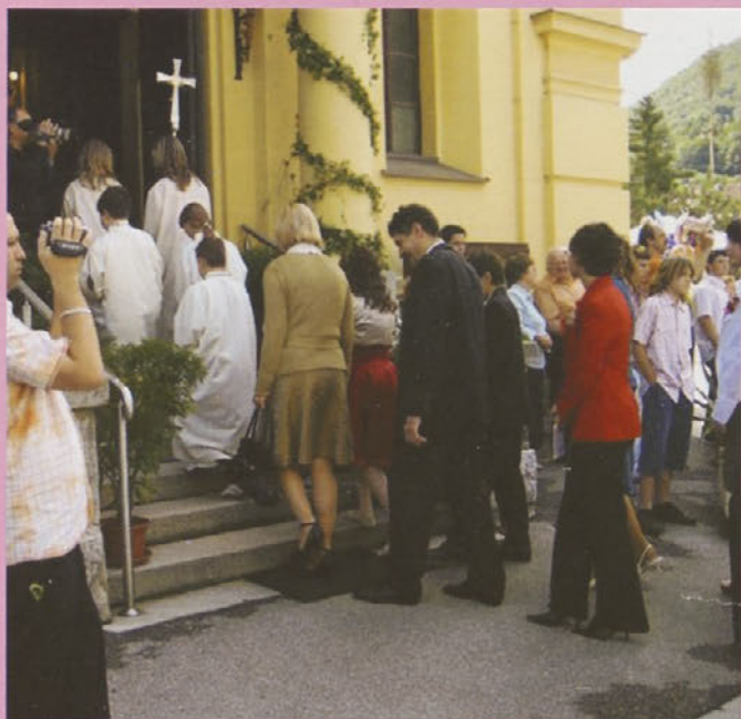
Vstopanje v cerkev s križem spredaj