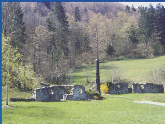
Komemoracija v Orehovici

V četrtek, 17. maja 2007, so se krajanje zbrali pri spomeniku v Orehovici, ki nosi resnično zgodbo: 17 mrtvih, polno trpljenja, žalosti in obupa, ki ga je nemogoče opisati z besedami. Ob tej priložnosti so člani sveta KS Izlake ter predstavniki občine Zagorje ob Savi k spomeniku položili cvetje.