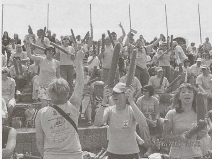
Navijači na tribuni