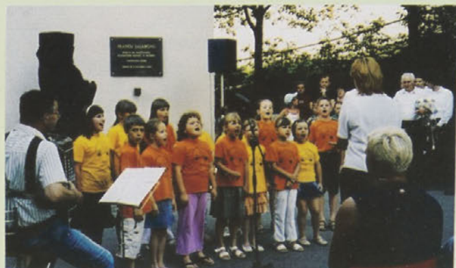
Vi ste za nas, mi zdaj za vas – pevski zbor OŠ Tončke Čeč