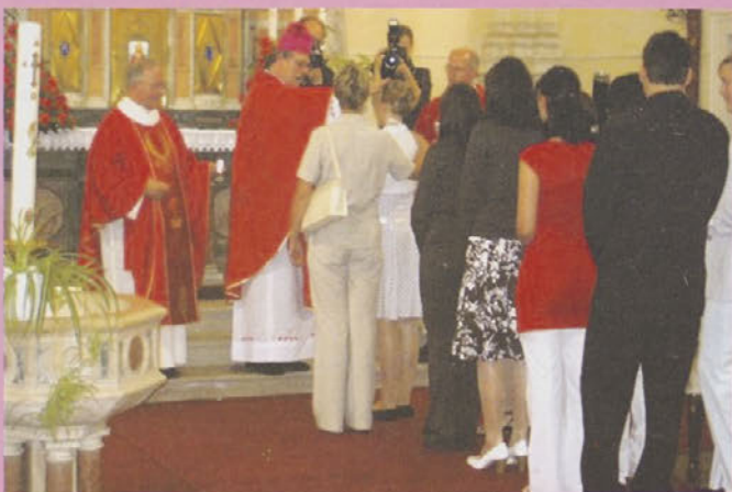
Prejem zakramenta sv. birme