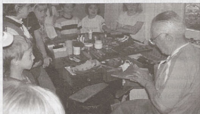
V čevljarški delavnici

čevljarški mizi na sredi sobe je bilo razstavljeno številno čevljarstvo orodje, na delovnem pultu ob steni pa vrsta kopit različnih velikosti in oblik.