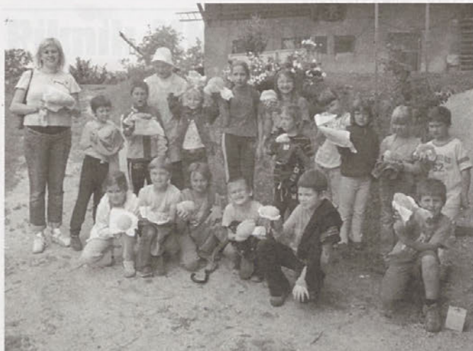
Vsak ima svoj hlebček

Nekateri od učencev so prvič videli krušno peč in so se, tako kot v starih časih, spravili nanjo. V veselem pričakovanju so z vrha peči prisluhnili pravljici, ki je opisovala peko kruha.