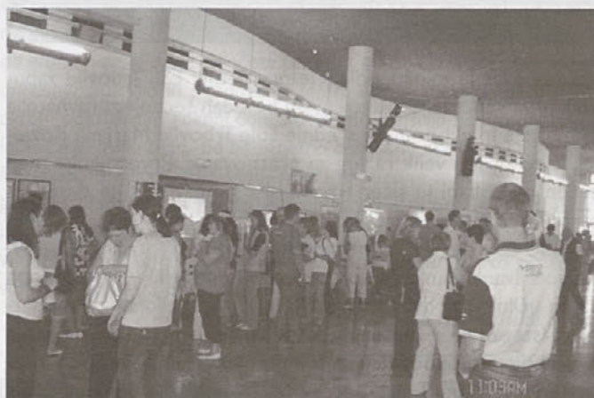
Utrinek s sejma v avli DD

realizirale v naslednjih mesecih. Osnova za analizo bodo rezultati vprašalnika, ki so ga vročili vsem sodelujočim delodajalcem. Sicer pa je bil sejem v splošnem dobro sprejet, kar dokazuje tudi izjava ene od obiskovalk, ki je izrazila, da bi lahko takšne sejme (srečanja) organizirali večkrat letno. Glede na prve pozitivne odzive in pohvale tako delodajalcev kot brezposelnih oseb, lahko pričakujemo, da bo sejem organiziran tudi prihodnje leto.