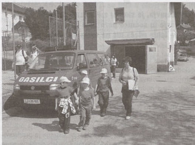
Mali šolarčki »mladi gasilci«

PGD Prapretno in GZ Hrastnik sta v soboto, 9.6.2007, organizirala tretji orientacijski pohod gasilske mladine.