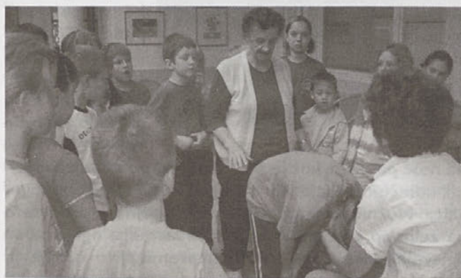
Igre naših starih mam

Stanovalci so predstavili nekaj iger, katere so se igrali v svoji mladosti. Ena od stanovalk doma je učencem pokazala izdelovanje punčke iz cunj, s kakršnimi so se nekoč deklice igrale. Povedali so, da nekoč niso imeli takšnih igračk, kot jih imajo otroci danes in da so za igro uporabljali kar predmete iz vsakdanjega življenja. Avtomobilčki so bili kar leseni kvadri, ki so jim dodali kolesca. Otroci so se v starih časih veliko več družili in preživljali čas na prostem.