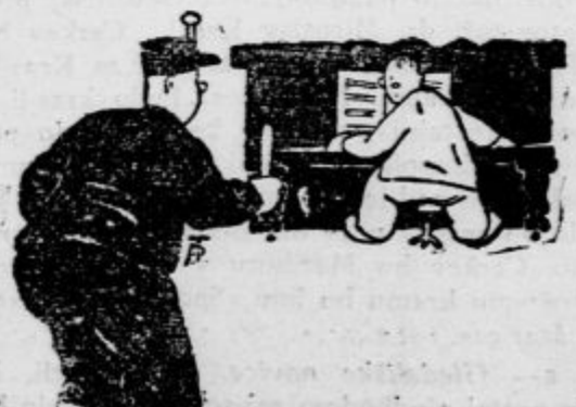
»Kaj pa iščete tukaj?« »Povedali so mi, da tukaj strašno mrovarijo nekega gospoda Beethovna!« (»Tidans Tegze«)