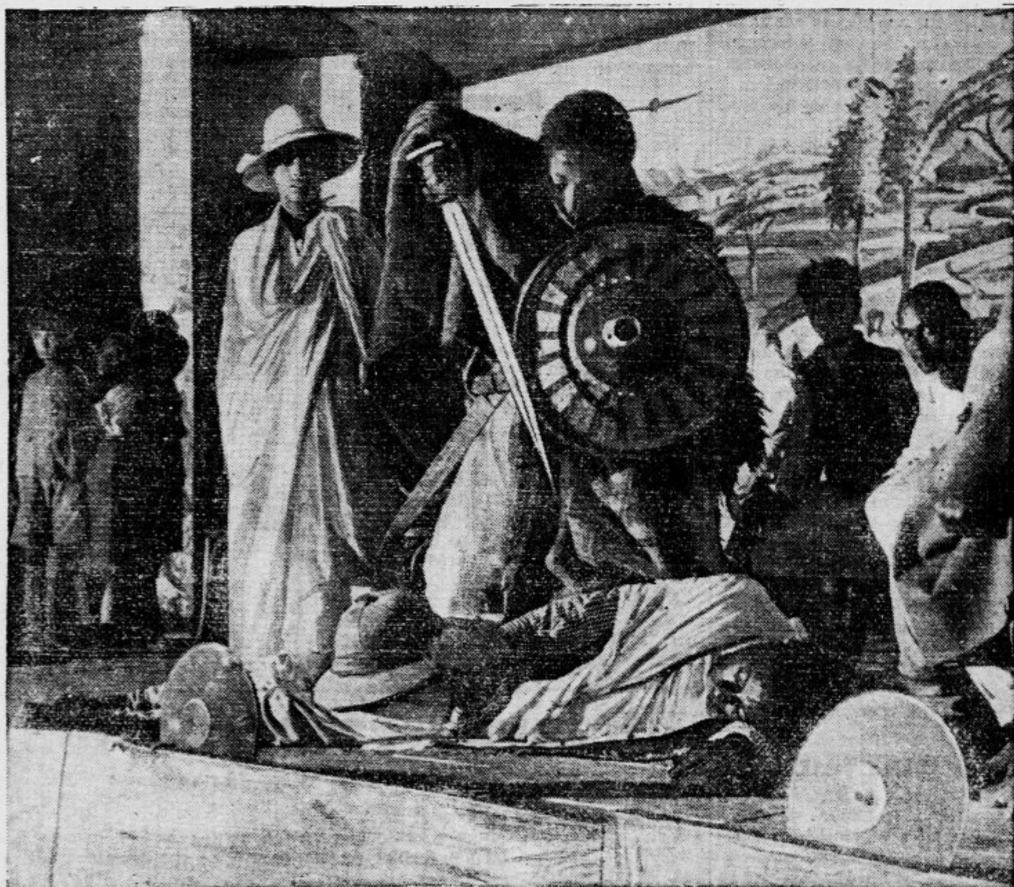
Čeprav očita Abesincem, da so neuko ljudstvo, imajo vendarle zelo radi gledališke predstave. Njih posebnost je, da igrajo vse vloge tudi ženske, moški igralci, kajti ženska v Abesiniji ne sme stopiti na oder. Igralec z mečem in ščitom je pravkar zadal svojemu nasprotniku na tih smrtno rano...