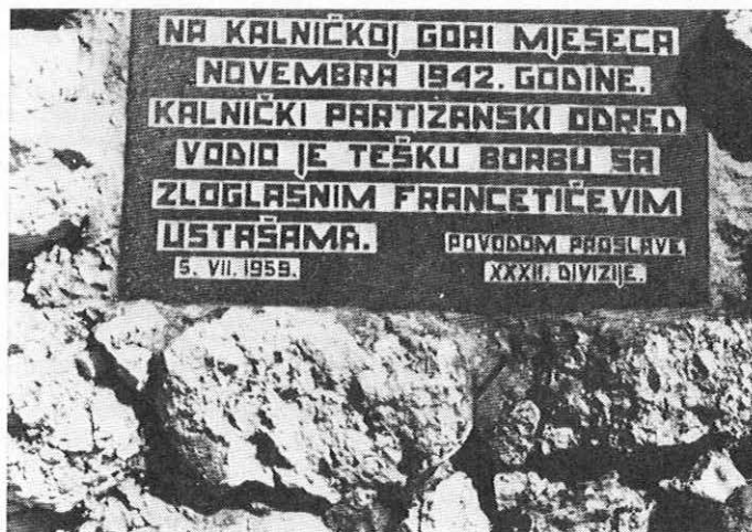
Spominska plošča na trdnjavi na Kalniku