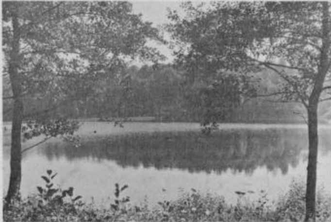
Čista voda v jezeru sredi haloških gozdov, na njenem dnu „straši“ več kot 150 nad meter dolgih somov.