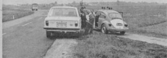
Patrolja milice pri opravljanju delovnih nalog