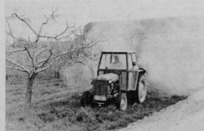
Učinkovito strojno škropljenje.

V sadovnjakih se v tem času že izlegajo zimska jajčeca rdečega pajka. Zaradi tega kmetijski strokovnjaki smatrajo, da je ta teden že primerni čas za uporabo animerta ali galecrona. Če je pojav rdečega pajka manjši bomo škropili šele po tem, ko se bodo izlegla vsa zimska jajčeca rdečega pajka. Vsa škropiva lahko sadjarji dobijo v poslovalnici „zadružnik“ KK Ptuj, obrat kooperacija, na Srbskem trgu v Ptuj.