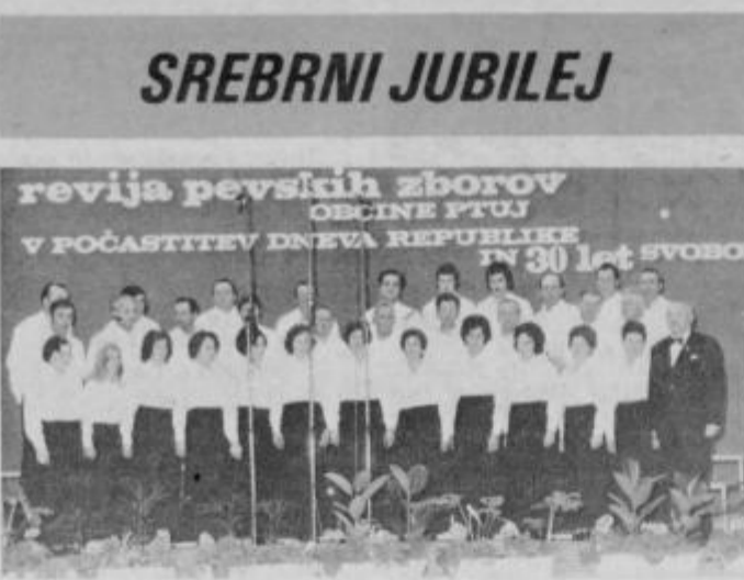
Pevski zbor PD Rudar Sever iz Gorisnice na lanskim občinski reviji.