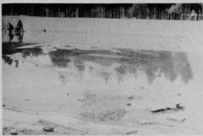
Črpanje vode iz onesnaženega olimpijskega bazena.