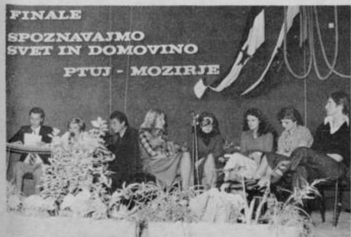
Zmagovalna ekipa ptujskih srednjih šol