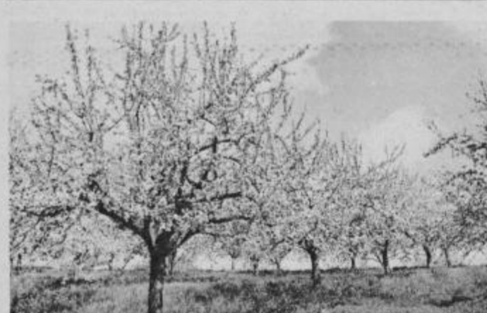
Cvetoče jablane v sadovnjaku KK Ptuj.

Obrat pri Lenartu je bil zgrajen v kratkem času. Postavljen je ob glavni magistrali na severovzhodnem delu Lenarta, ki je s svojo zmogljivostjo največja in najmodernejša proizvodnja za to vrsto tehnologije v Jugoslaviji. Obrat je stal preko 21 milijonov osnovnih in 9 milijonov dinarjev obratnih sredstev, izdelujejo pa izolacijsko steklo K 75 M. Zaposluje 30 delavcev, do konca leta se bo število zaposlenih še povečalo. To je tudi nova pridobitev za delavce, ki se od Lenarta zaposlujejo v Mariboru. J. Lorber