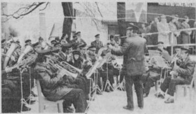
Sindikalna godba delovnega kolektiva IMPOL iz Slov. Bistrice med nastopom v Črešnjevcu. Tekst in foto: V. Horvat