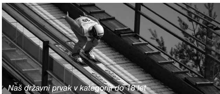
Naš državni prvak v kategoriji do 18 let