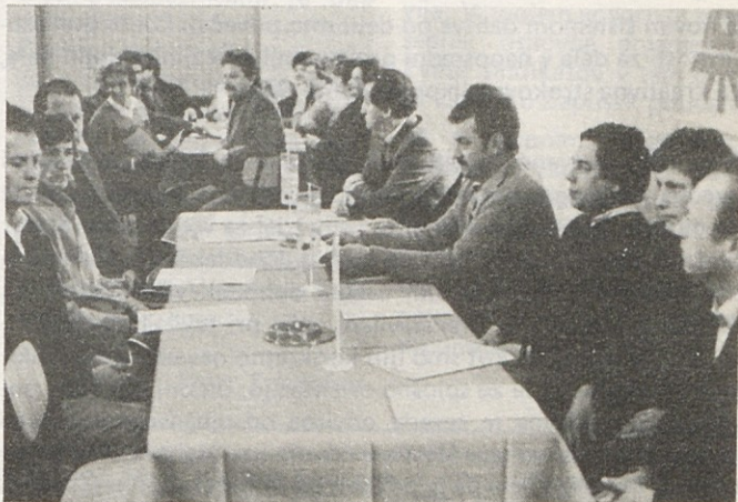
Delavci obrata Keramike tozda Gradbeni elementi so 28. novembra 1984 proslavili 10 let dela tovarne keramičnih talnih oblog. Za deset let dela je 43 zaposlenih prejelo posebna priznanja.