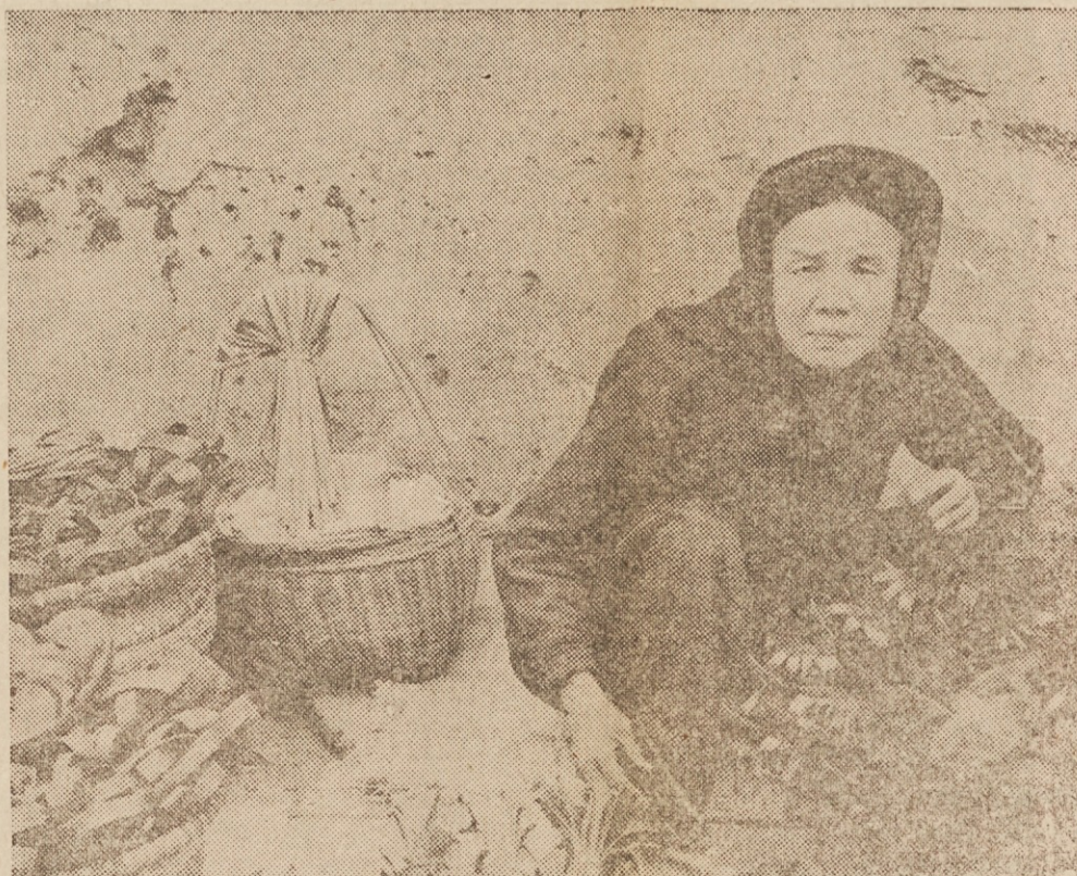
PRODAJA NA CESTI — Vietnamka v Hanoi prodaja sandale kar ob cesti, kjer je razstavila svojo robo. Tracy Wood, sodelavec UPI, ki je bil nedavno v Severnem Vietnamu, poroča, da nosijo starejši otroci in odrasli črne ali modre hlače in gumijaste sandale, medtem ko so mlajši otroci oblečeni v bolj barvite in pisane oblekice.