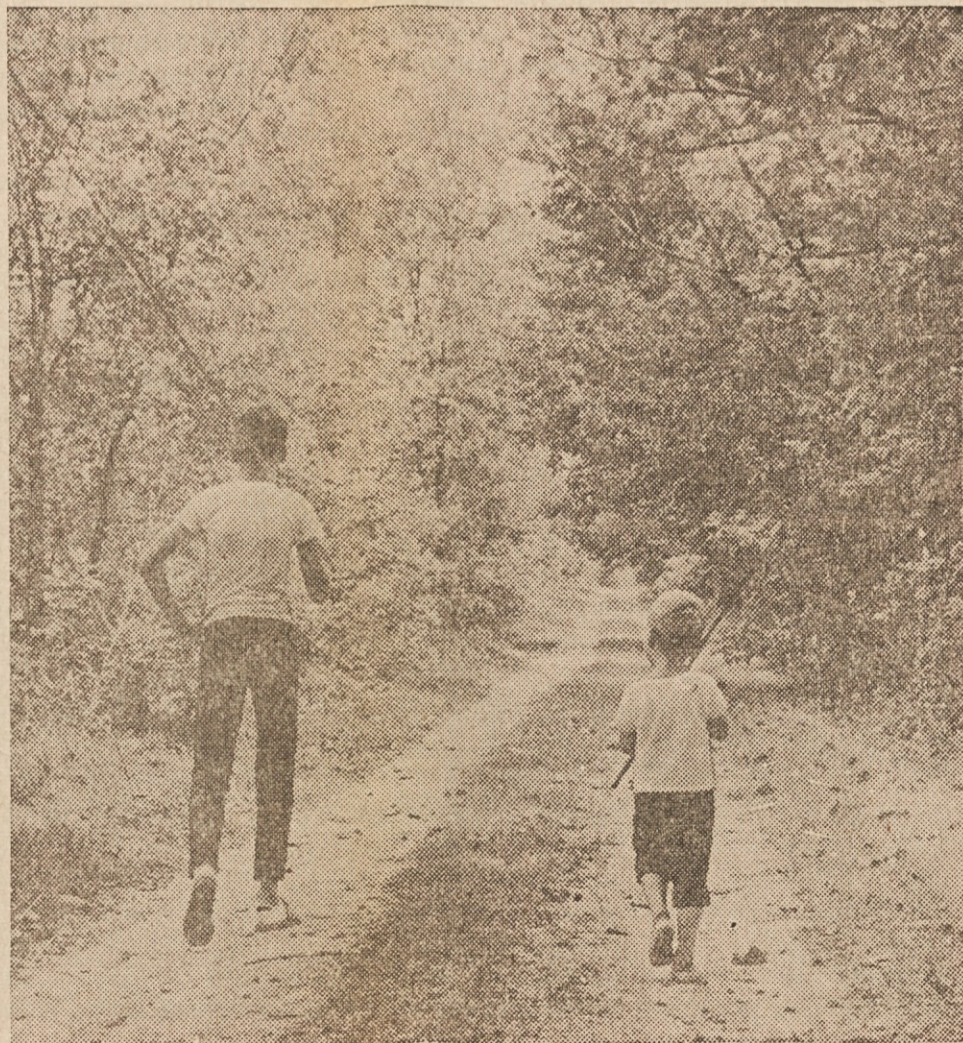
PO GOZDNI POTI — Fantička sta se spustila po gozdni poti proti bregu v Westervillu, Ill., kjer upata ujeti kako ribo.

on tako spremenil v svojem vedenju, sedaj sem moral prenehati z vsakim dvomom, ko sem videl, kako strastveno so mu žarele njegove oči. Tudi za hip ni odtegnil svojih pogledov od nje. Luciena sem gledal od strani, spremljevalko njegovo pa naravnost v obraz, zato sem jo lahko natanko opazoval. Krivično bi bilo, ko bi trdil, da je to ženska iz ulice. Obleka ji je bila sicer priprosta, sivkasta, toda zelo primerna.