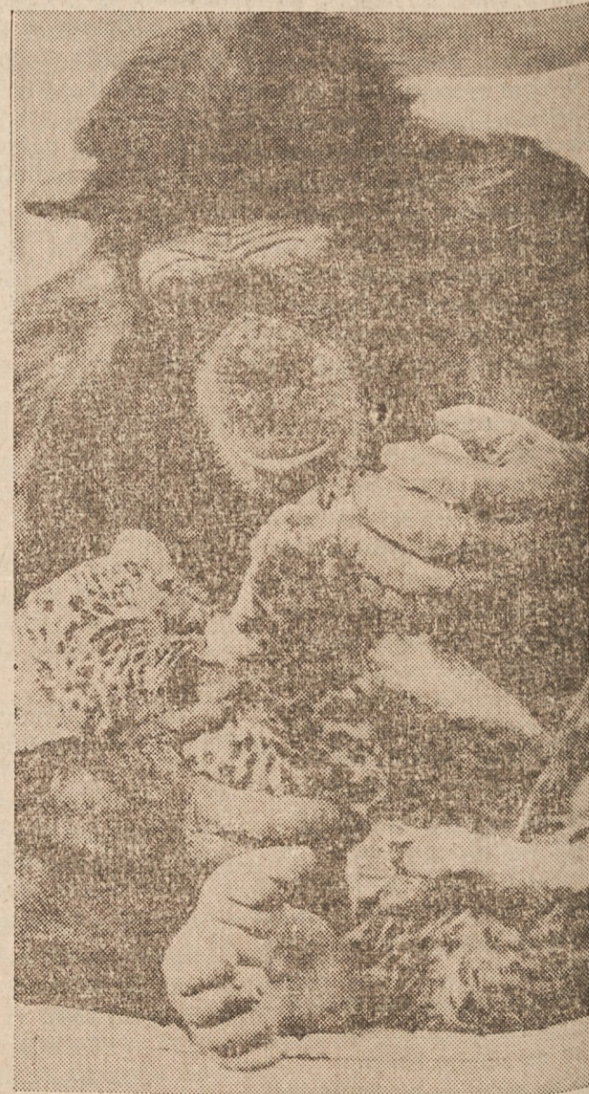
NOBENIH PREDSDOKOV MED ŽIVALMI! — To je naš slovo zgornje slike iz Velike Britanije na mednarodni fotografski razstavi v Sofiji v Bolgariji. Vprašanje je, ali "predsodkov" tudi ne bo, ko bo tale leopard ek odrastel.