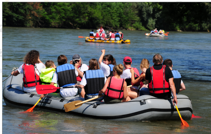
Raziskovalni spust po Muri (Zveza društev Moja Mura)