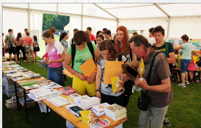
Predstavitvene stojnice društev in organizacij v glavnem šotoru