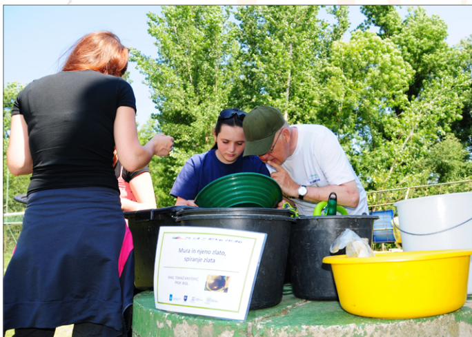
Iskanje zlata v Muri

Pripravil Zavod RS za varstvo narave, OE Maribor