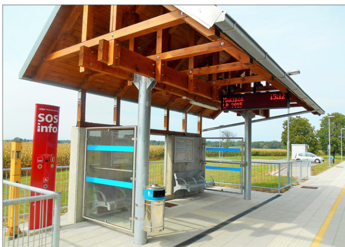
Svetlobni prikazovalnik na postajališču Veržej.

V bližini postajališča je postavljena tudi naprava (stember), s katere je možno telefonirati na dispečerski center za vodenje prometa z namenom pridobitve dodatnih informacij o vlaku oz. poslati sporočilo o kakšnem izrednem dogodku na sami postaji ali progi.