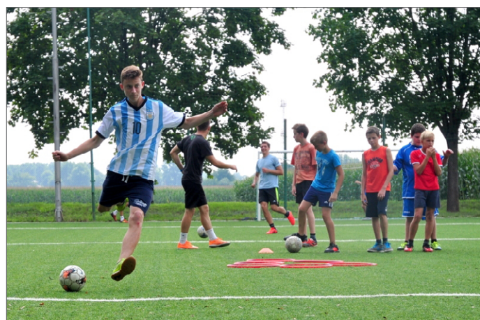
Vse foto: arhiv Zavoda Marianum Veržej