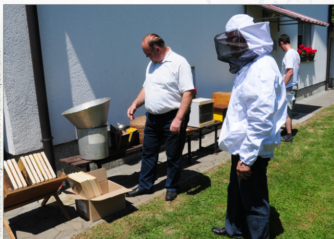
Dan odprtih vrat Čebelarkega društva Veržej