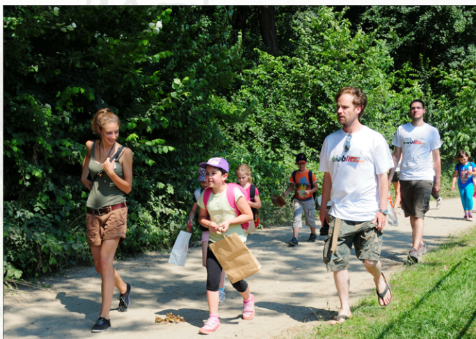
Vodeni raziskovalni sprehodi