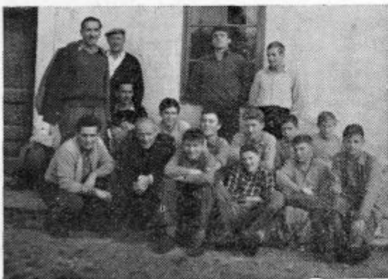
Jamarji ob raziskavi stote jame v Podjesenu

Popoldne se je zvedrilo in ni nas mikalo,