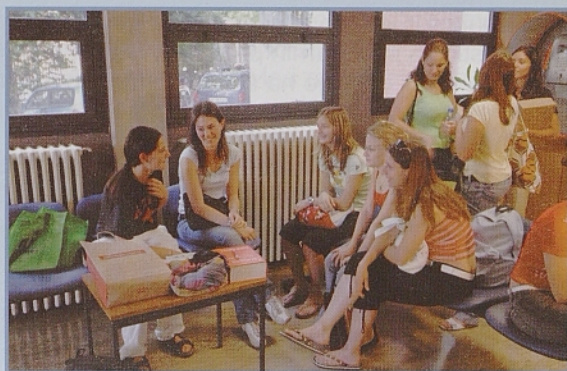
odločila za italijansko šolo Nordio.