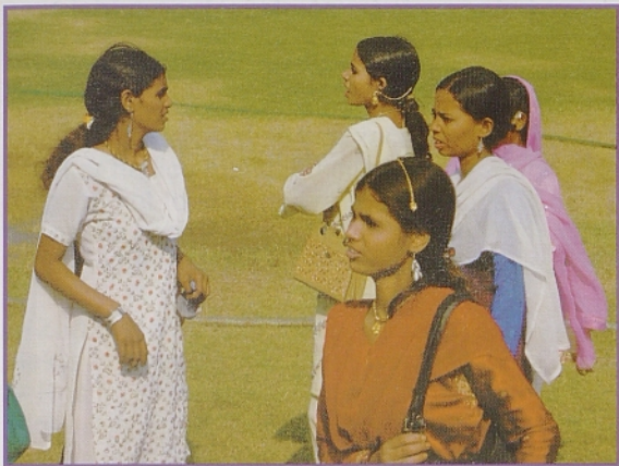
Ženske v Indiji.

« Zgodba pripoveduje o Akhili, 45-letni Indijki, stari devici, državni uslužbenki oz. davčni uradnici in zgodovinar-