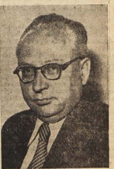
Erich Ollenhauer, predsednik zahodnonemške socialno-demo- kratske stranke

sporazumov, kakor pravijo tu. Soci- alnodemokratska opozicija je skle- nila delno izpopolniti in razširiti svoje metode boja proti pariškim sporazumom. V svojem komunike- ju se predsedstvo stranke obrača na nemški narod in ne samo na bonn- ski parlament. Razširjena plenarna seja predsedstva je sklenila, da v svojem načrtu o razvoju in najrazli- čnejših oblikah stikov z množicami in predstavniki Vzhodne Nemčije ne morejo računati ne na zahodne države, ne na SZ, pa tudi ne na bonn- sko vlado, kot na resne partnerje v boju za združitve Nemčije. Za- to bi socialni demokrati radi dali pobudo in delno organizirali čim pogostejše prehode čez consko me- jo in čim tesnejše stike med obema deloma Nemčije. Poudarjajo pa, da s tem ne mislijo pripoznati vzhod- nonemške vlade.