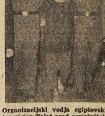
Organizacijski vodja egiptovskih teroristov Talat pred usmrtitvijo

Fremagati je bilo treba mnoge ovrte, da je dobilo nekaj domaših no- vinarjev in fotoreporterjev dovolje- nje, da so smeli prisostvovati usmr- tivilni teroristi. Tula novinarja ava bila navzoča samo dva, nek Francoz in jaz. Po dobrih 25 letih je Egipt