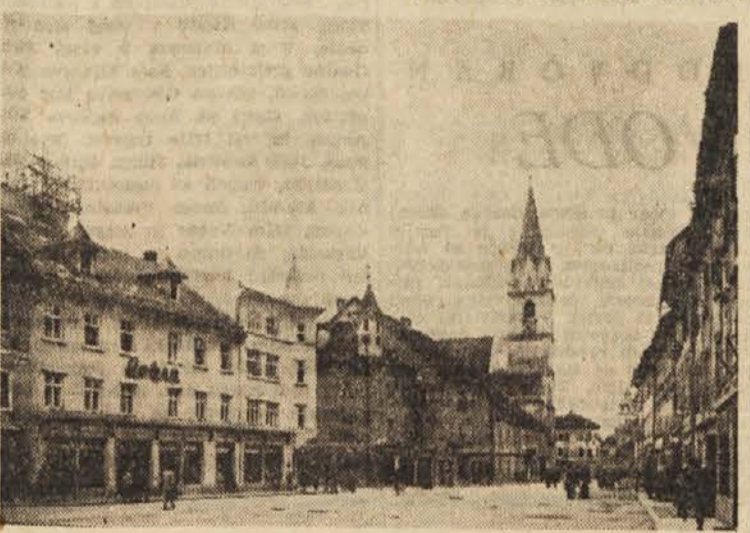
Kranj — Titov trg

Čeprav živinorejci s področja mesta lahko krijejo le manjši del potrošnje mleka v Mariboru, je njihov prispevek zelo pomemben. Ta njihova vloga poraste predvsem takrat, kadar se zmanjšuje dovoz mleka s podeželja. Zadnje tedne so mariborski potrošniki to močno občutili, ker je količina mleka, ki jo zbere vsak dan mariborsko podjetje z mlekom, padla za več kot polovico. Poleti je podjetje pripeljalo v mesto dnevno tudi do 14.000 litrov mleka, sedaj pa komaj 5000 do 6000 litrov. Da bi krili povpraševanje po mleku, je podjetje prenehalo v teh kritičnih mesecih proizvajati mlečne izdelke. Zvišali so tudi odkupno ceno, da bi živinorejci rajši prodajali svoje mleko. Sicer tudi s tem ukrepi ne bodo odpravili vseh težav, ker so le-ta posledica slabše moznosti zaradi nedovoljnega krmiljenja živine.