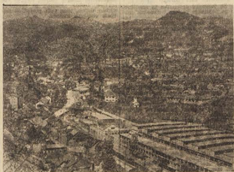
Pogled na Trbovlje

bulantami. To mnenje je sicer načelno lahko pravilno, v kolikor pri tem ne upoštevamo pretiranih lokalističnih tendenc. Toda za sedaj so na področju bodočih štirihih komun pogoji takšni, da ni misliti na tako idealno in popolno decentralizacijo zdravstvene službe. Mimo tega pa se tudi za bližnje in daljno bodočnost postavlja vprašanje, ali bi takšna decentralizacija bila sploh potrebna, uместna, koristna in naposled sploh rentabilna. Lahko je reči: zgradili bomo