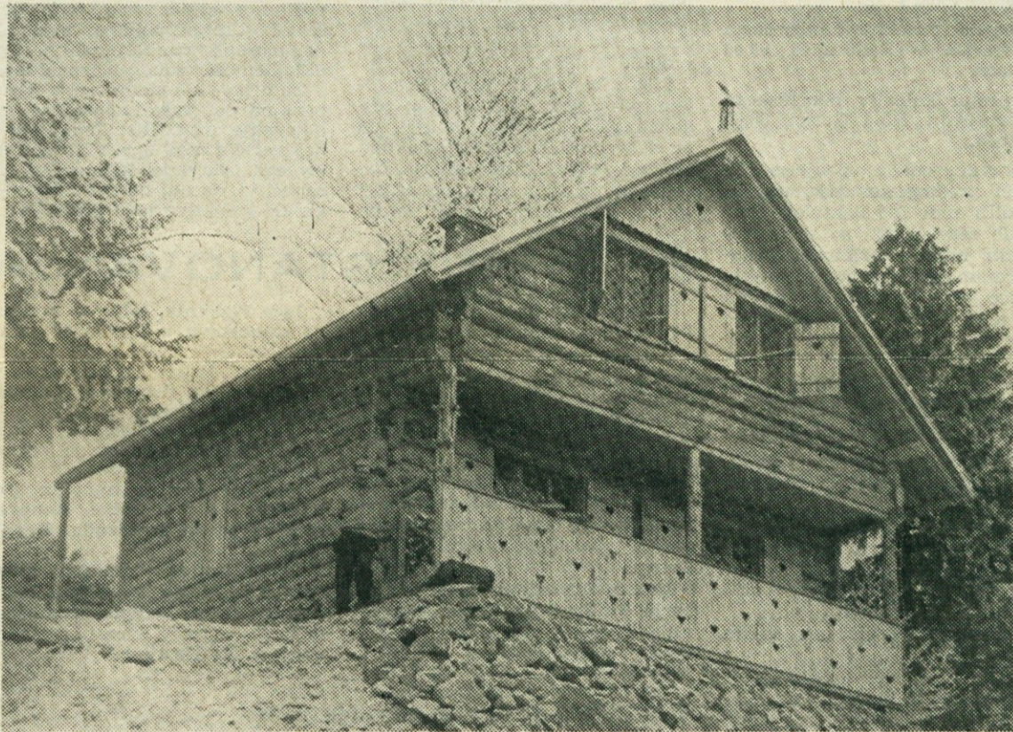
To je počitniški dom našega kolektiva na Jezercih pod Krvavcem (1435 m). Lep je ta naš dom, a vse premalo poznan in obiskan