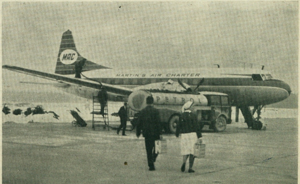
Na letališču na Brnikih že sedaj oskrbujemo letala z naftnimi derivati