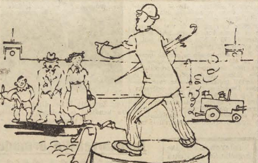
Govornik KP Anglije v Hyde parku: »In še to so mi ukazali iz Moskve, naj vam povem, da mi oni prav ničesar ne ukazujejo, in da sem popolnoma neodvisen v svojih izjavah...«

Angleška informbirovska agentura je pred kratkim izdala brošuro »Pot Anglije k socializmu«. V njej piše: »Anglija bo uresničila socializem po svoji poti ... po lastni poti in v lastnih pogojih... Ni res, da hoče KP Anglije uresničiti sovjetsko oblast in ukiniti parlament.«