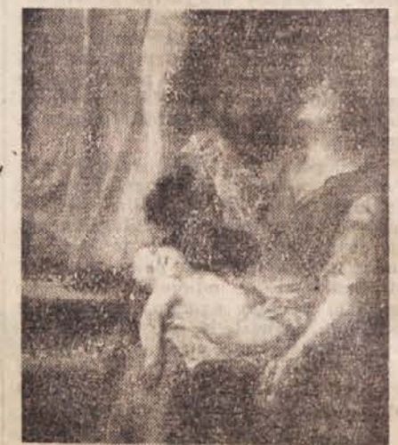
Kremser-Schmidt: Mati z mrtvim otrokom (detalj slike iz samostanske cerkve v Velesovem pri Kranju)

V njegovih delih imamo tudi pri nas kar lepo število izredno kvalitetnih baročnih umetnin. Še večjega pomena pa je bilo za razvoj našega pobaročnega slikarstva na prelomu stoletij dejstvo, da