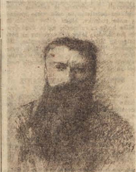
Rodin: Lastna podoba