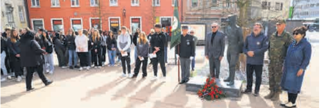
S spominske slovesnosti ob 150. obletnici rojstva generala Rudolfa Maistra

Ob spomeniku Rudolfa Maistra – Vojanovega je 29. marca potekala slovesnost v počastitev 150. obletnice njegovega rojstva. Pripravilo jo je ptujsko Društvo generala Maistra.