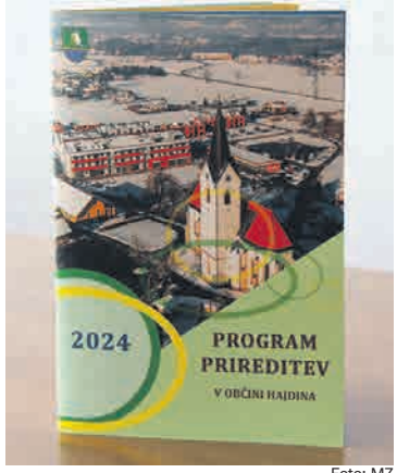
V prireditveniku so podatki o več kot 200 prireditvah v letošnjem letu.