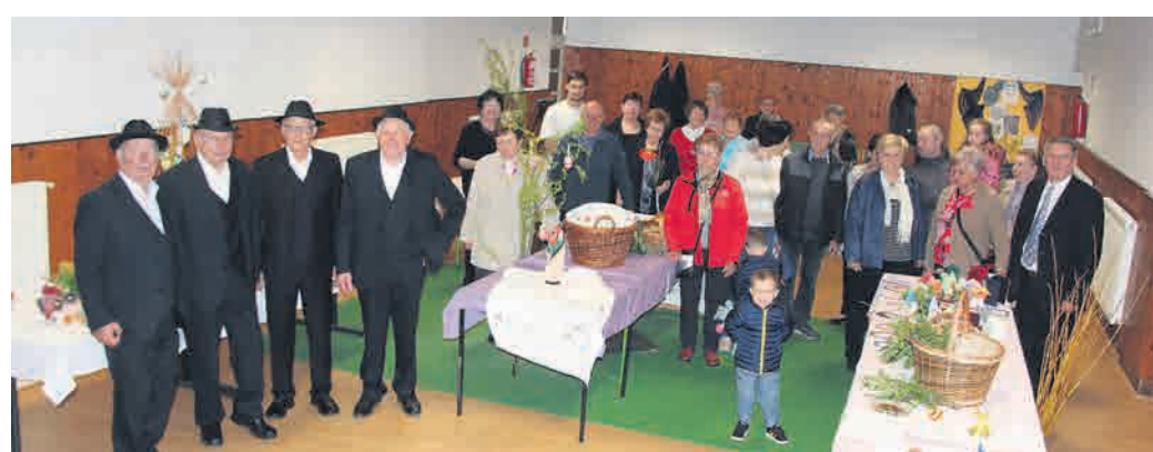
Razstavo so svečano odprli na velikonočno soboto.

Hajdinčanke so izdelke za razstavo ustvarjale dalj časa. „Srečujemo se vsak ponedeljek, običajno se ukvarjamo z ročno-