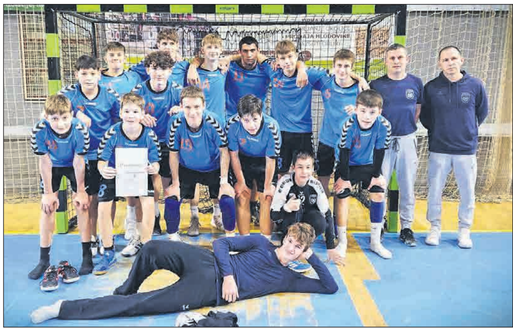
Rokometna vrsta OŠ Ormož se je uvrstila na finalni turnir osnovnošolskega državnega tekmovanja.