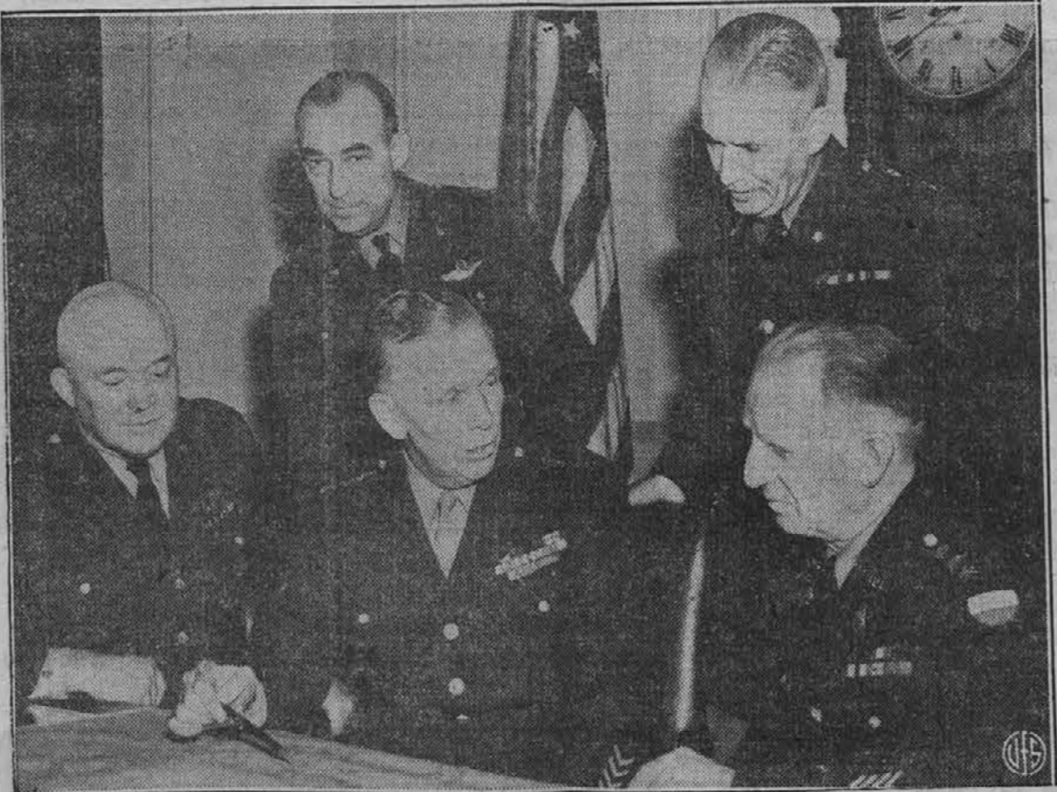
Gornja slika je bila posneta na posvetovanju vrhovnih vojniš poveljnikov v Washingtonu. Od leve na desno so: General Henry H. Arnold, poveljnik zračne sile; general George C. Marshall, štabni načelnik; general Lesley J. McNair, poveljnik vojne sile na tleh; stoječa v ozadju sta: general major J. T. McNarney, pomočnik štabnega načelnika in general major Brehon B. Somervell, poveljnik za vojne dobane.