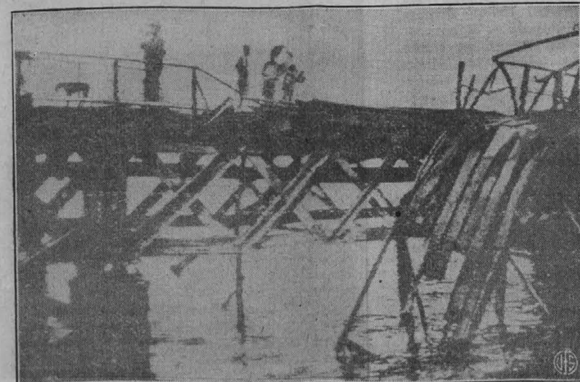
Ko so Japonci zavzeli otok Java, so se takoj pričeli pripravljati za splošen napad na Avstralijo. Gornja slika nam kaže posledice japonskega napada na avstralsko mesto in pristanišče Darwin, ki je strateški pomemben za obrambo Avstralije. Slika je bila posneta radiu poslana iz Londona.