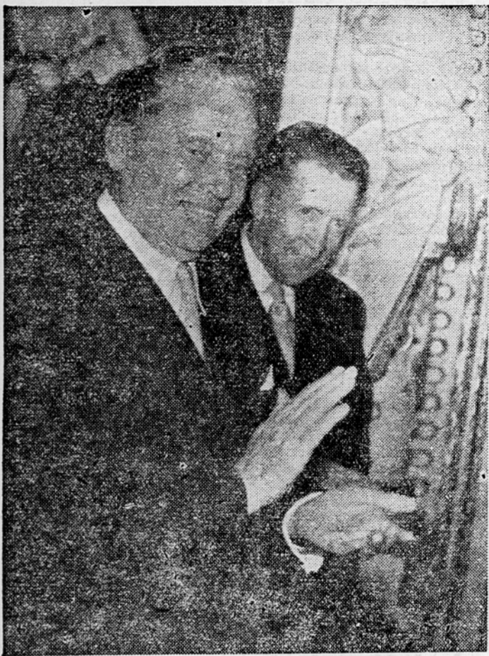
Predsednik republike tovariš Tito je bil včeraj v ljubljanski operi pri predstavi »Traviata«