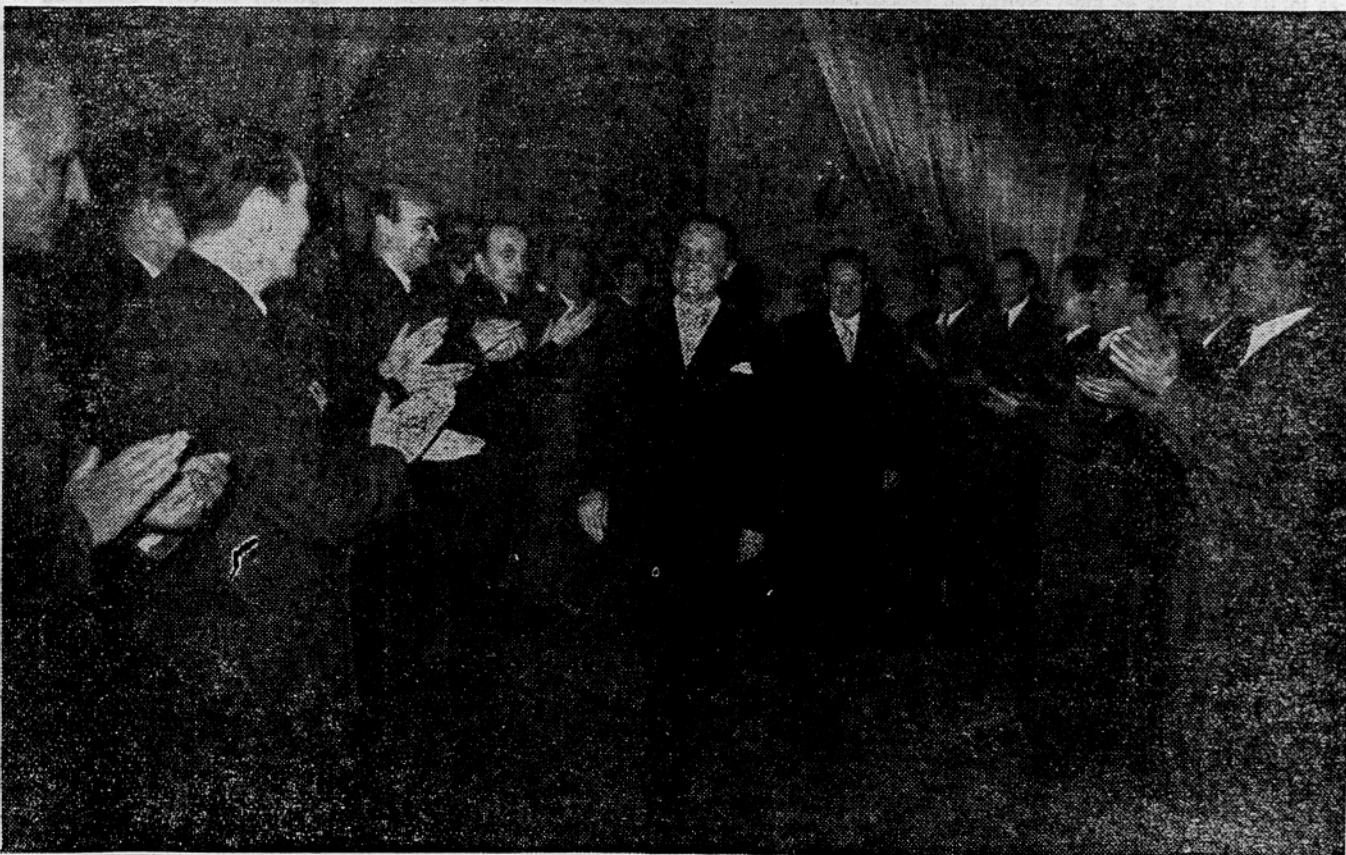
Ob sprejemu v vladni palači se posreduje pozdravni telegrami tovariša Tita

Ko se bo začela proizvodnja v livarni pri Ilijašu, bo prenehala obratovati železarna v Varešu, ki je eden izmed najstarejših industrijskih objektov v Bosni in Hercegovini. Čez nekaj mesecev bodo livarne iz Vareša prenesli v Ilijaš, prihodnje leto pa bodo prenesli tudi vareske plavže in ostale naprave. S premostitvijo strokovnih delavcev iz Vareša bi bil rešen tudi problem delovne sile v novi livarni.