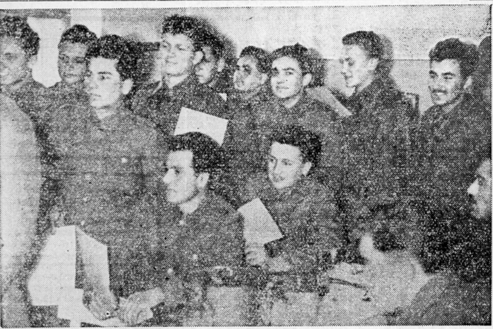
Večkrat in danes je pred odhodom na prakso 95 gojencev Vojne šole iz Senvidca oddalo v zavodu za transfuzijo 25 litrov krvi. Po prostovoljni oddaji krvi osebja vojne bolnišnice, se posamezne vojne edince zadnje dni že organizirano odzivajo tej humanitarni akciji.