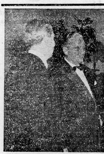
Maršal Tito v razgovoru z grškimi ministrom za zunanje zadeve g. Stefanopolosom na Brionih

Pariz, 9. februarja. (Tanjug). Nocoj o polnoči začne veljati pogodba o mednarodni organizaciji za premost in jektu, znana pod imenom Schumanov načrt. Z uveljavljanjem te pogodbe bodo odpravljene vse carinske in druge omejitve za prost promet med dveh važnih surovin v šestih državah, članicah Schumanovega načrta. Od polnoči dalje postane celotno področje treh držav enotno tržišče za premost in jektu. Po pogodbi bodo postavili čim nižje cene, po katerih bodo te države redno kupovale na tržiščih.