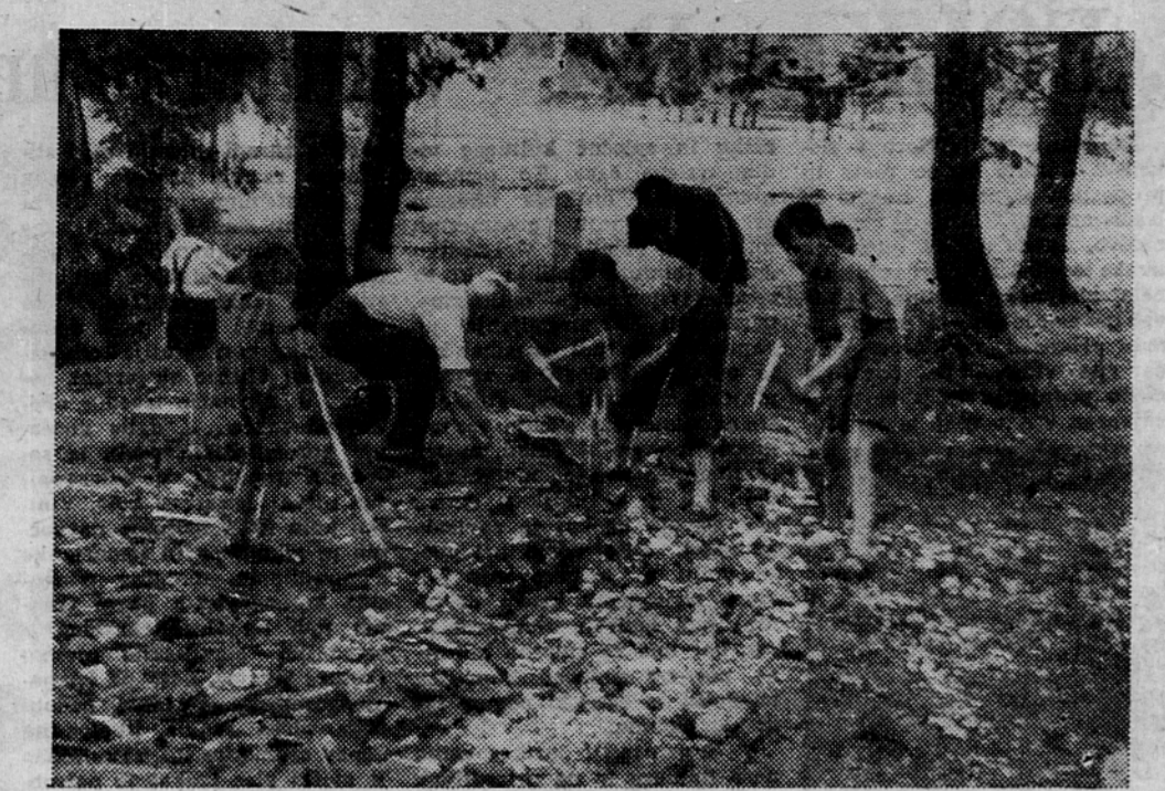
Teran »Vana Cankarja«, I. Rajona v Ljubljani urejuje v nekdanjem nuskem vrtu otroško igrišče. Pri pripravah pomagajo tudi pionirji

»DOL. TOPLIČE« V Dol. Toplicah je leta v nedeljo 1. junij prvi pregled krompirišč zaradi kolodarskega hrošča. Pri pregledu niso našli nobenega hrošča niti ličinke, kar pa ne sme biti vzrok, da bi s predelovanjem krompirišč prenehali.