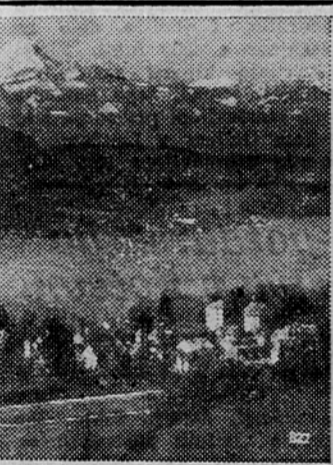
18. junija odpotuje skupina 300 otrok v počitniško zdravstveno kolonijo v Sekiro pri Ribnici ob Vrbskem jezeru na Koroskem. Skupno z otroki potuje v isto kolonijo tudi 80 pevecv študentskega pevskega zbora »Tone Tomšič«, ki bodo gostovali s koncerti v različnih krajih Slovenske Koroske. Prva izmena bo ostala na Koroskem mesec dni. Naši otroci bodo v koloniji na podlagi zamenjave, ker pride enako število avstrijskih otrok v naše kolonije na morje. Nameravane so tri izmene. — Sekira je majhen, a zelo lep kraj na južni obali Vrbskega jezera, približno deset kilometrov oddaljen od Celovca. — Naša slika kaže kraj Poreče ob Vrbskem jezeru, v ozadju je Kepa v Kavankah in Gure, ki delijo dolino Drave od Vrbskega jezera. B. B.

New York, 5. jun. (Tanjug): Predstavnik ameriške vlade je predlagal, naj bi bil danes sestanek med sindikalnimi voditelji in predstavniki jeklarske industrije, da bi prenehala stavka delavcev, zaposlenih v tej industriji. Delavci jeklarske industrije so začeli stavkati pred dvema dnevnoma, ko je ameriško vrhovno sodišče razveljavilo odločitev predsednika Trumanova o državnih upravi jeklarske industrije. Predstavnik sindikatov so sprejeli poziv, da se bodo sešli s prestavniki družb.