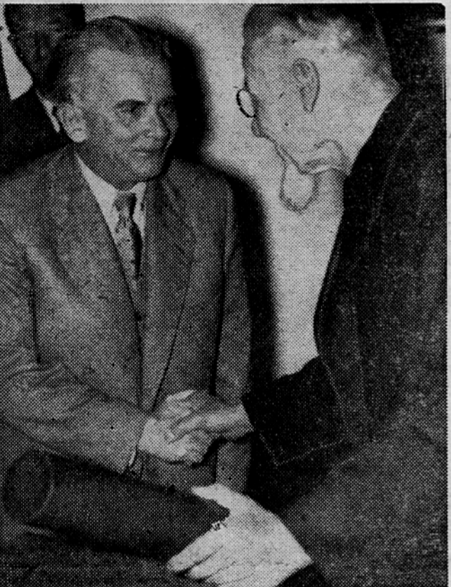
Predsednik Prezidija Josip Vidmar testita slavljenca

Profesorski zbor Tehniške visoke šole na Dunaju je na svoji seji 12. decembra 1951 sklenil, da akademiku profesorju Josipu Plečniku podeli častni naslov doktorja tehničnih ved zaradi zaslug za ohranjanje in razvijanje evropske arhitektonske umetnosti na področju Dunaja. Ta sklep je bil izvršen 22. februarja leta 1952.