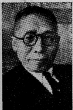
Predsednik južnokorejske vlade Sing Man Ri

Pariz, 5. junija (UP): Uradni predstavnik francoske vlade je včeraj izjavil, da bo Francija vsekakor podprla ZDA in Veliko Britanijo v njihovem protestu proti dejavnosti Sing Man Rija v Južni Koreji. Čeprav se niso poslali uradnega poziva Franciji, naj se pridruži protestu ZDA in Velike Britanije, pri-