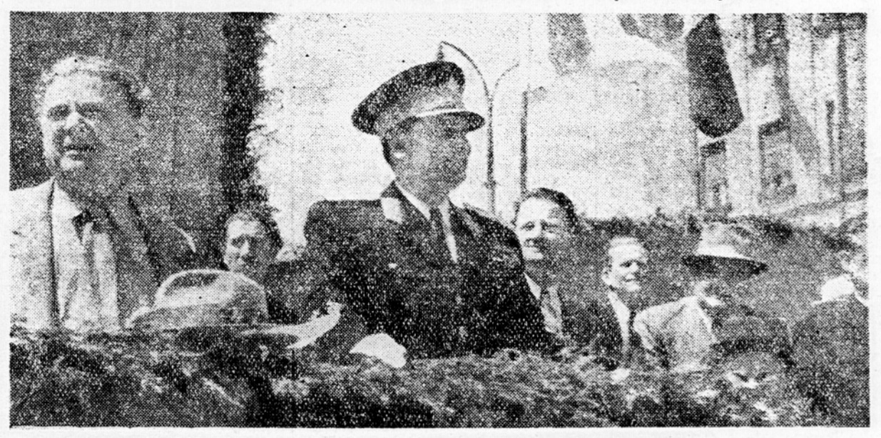
Maršal Tito na častni tribunici pri prvomajski paradi v Beogradu

Delovni kolektiv beograjske tekstilne industrije izraža v brzojavki maršalu Titu neomajno in neskončno zupanje ter obljublja, da bo izpolnjeval vse dane naloge in s tem prispeval svoj delež za uresničitev velikega petletnega plana.