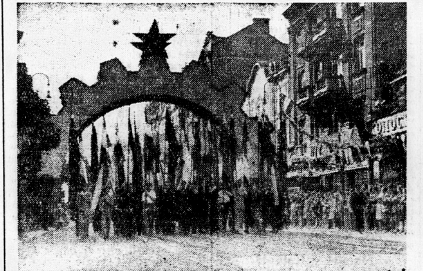
S prvomajske parade v Beogradu

Sklep uprave gradilišča o proglatitvi 33. razdelka za najboljšega bo sporočen vsem kolektivom na razdelkih in kolektivom glavnih delavnic.