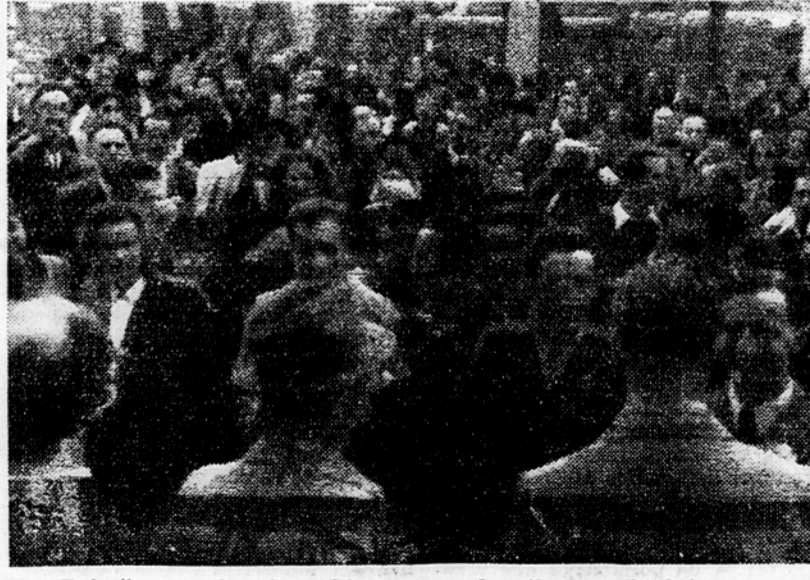
Prisrčen sprejem koroških pevcev ob prihodu v Ljubljano

Semena so v večini zadostovala. Kolikor pa jih je primanjkovalo, so kmetje zasejali njive z drugimi kulturami, kakor na primer z deteljo in krmisnimi rastlinami. Take primere so imeli v Misličah, kjer se je jesenska setev slabo obnesla in so morali ozimine preorati. Tudi umetnih gnojil je zadostovalo, le žal, da so nekatera prispela prepozno. Fizol je prispel pred nekaj dnevi. Lucerna je tudi že na polji. Tako bomo semenske potrebe več-