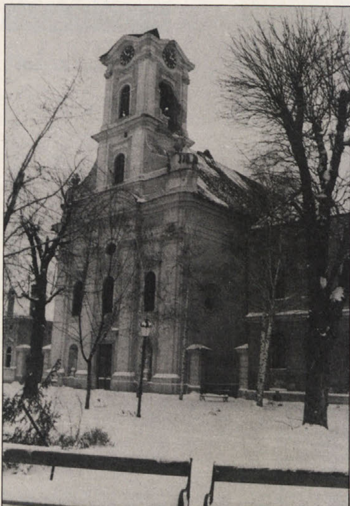
Razdejana cerkev v Vinkovcih.