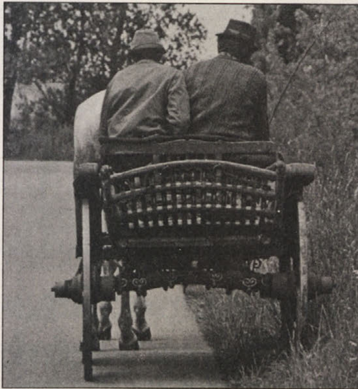
Ungarische Bauern auf der Fahrt in die Stadt.

Število pripadnikov madžarske manjšine v Srbiji, predvsem v Vojvodini, stalno upada. Leta 1953 jih je bilo še nad 500.000, po zadnjem popisu leta 1991 pa le še 342.000. Vzroki za dramatično upadanje številčne moči madžarske manjšine so mnogovrstni, predvsem nasilna asimilacija, nizka nataliteta ter množično odseljevanje. Demokratična skupnost Madžarov v Vojvodini je zato na tiskovni konferenci na Dunaju pozvala mednarodno javnost, naj pomaga ohraniti madžarski živelj v Vojvodini in v drugih delih Srbije, kot najbolj primeren zaščitni instrument pa je imenovala Haaško konvencijo.