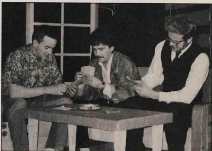
Prizor iz gledališke predstave.