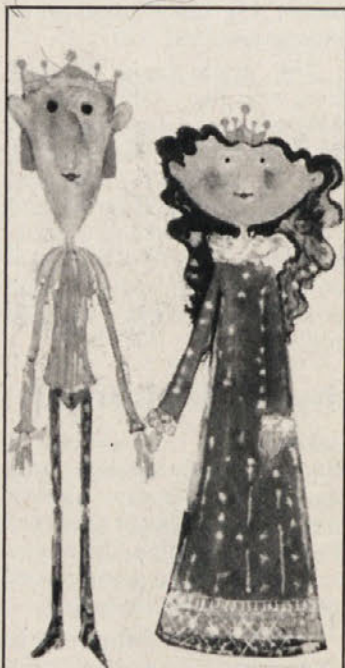
Predstava Lutkovnega gledališča Ljubljana: