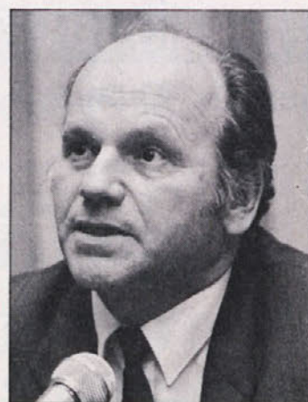
Dr. Jože Pučnik, predsednik socialdemokratske stranke Slovenije.

Vlada je priznala, da se res sooča z večjimi težavami kot je pričakovala, saj so na primer kljub razčiščevanju še vedno velike težave v sodelovanju s Hrvaško, Bosno in Hercegovino, posebej pa Srbijo. Tudi z Evropsko skupnostjo, v prihodnjih dneh naj bi njena delegacija obiskala Slovenijo, na primer