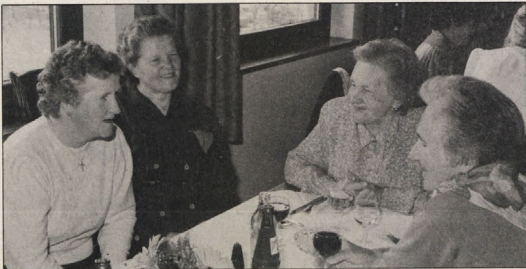
Sproščeno vzdušje na dnevu žena v Bilčovsu.