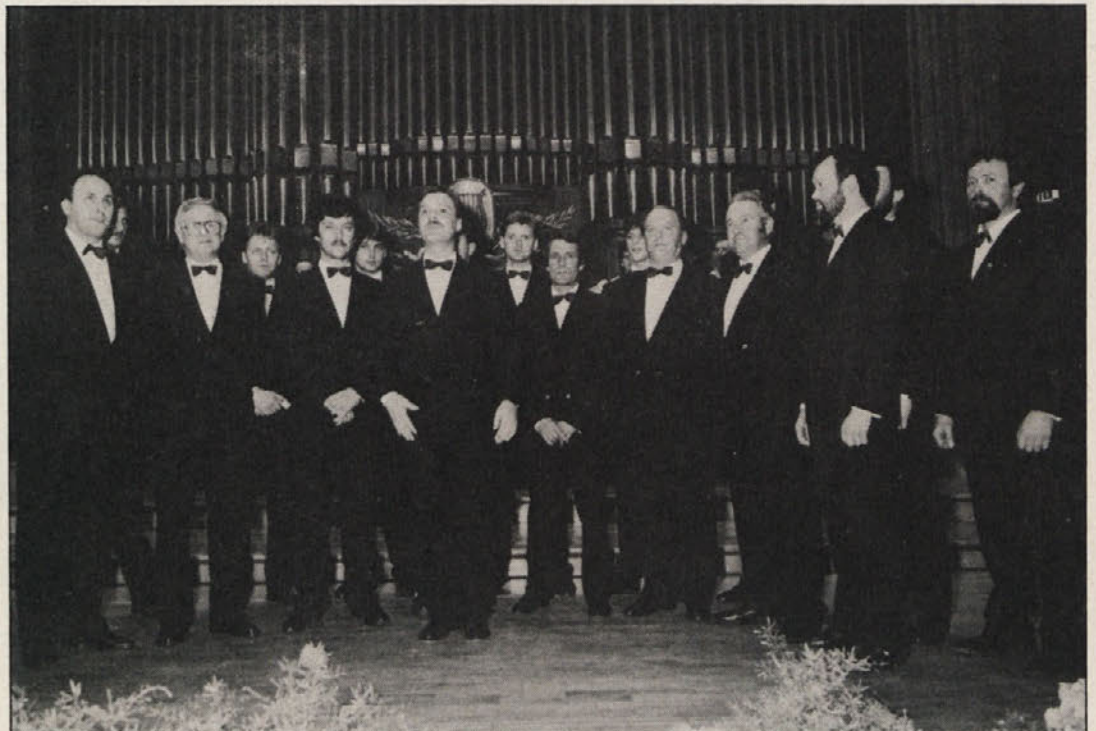
Moški pevski zbor „Kralj Matjaž“ je s svojimi pesmimi navdušil publiko.