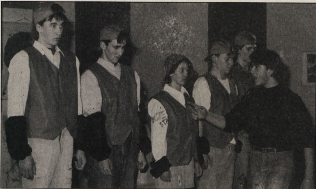
Birokrati na zagovoru pred Preklo.