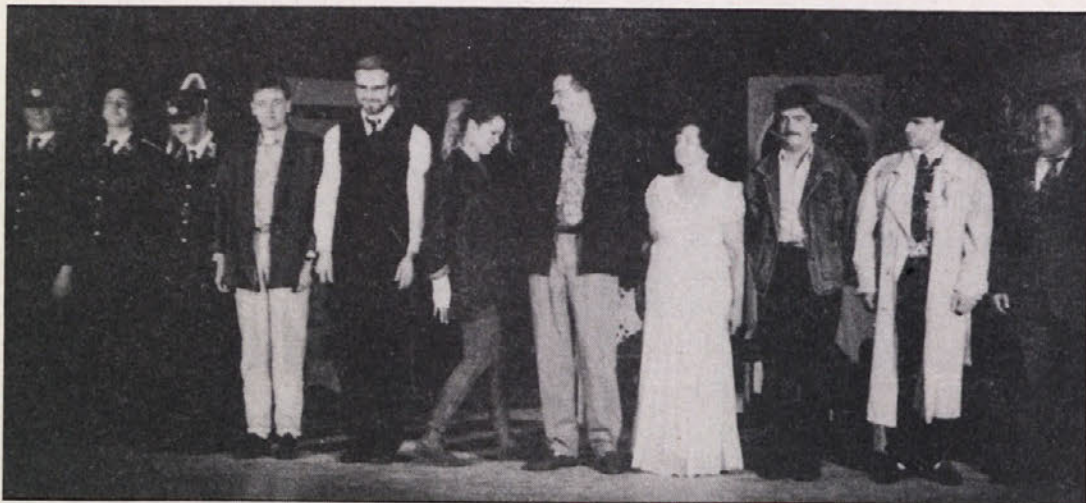
Igralci domačega Slovenskega prosvetnega društva „Radiše“.

Nedelja, 15. marec 15.00 Mladinski dom Celovec