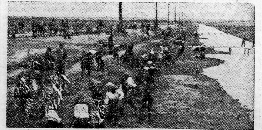
Na vsej trasi avtomobilske »Ceste bratstva in enotnosti od Beograda do Županje v dolžini 110 kilometrov so razvrščene mladinske delovne brigade Prve brigade, ki so začele delo v aprilu se bodo v prihodnjih dneh vrnile na domove, zamenjale jih bodo nove brigade 1 skupine druge izmene

Zastaja na gradiliščih v Beli Krajini je v veliki meri kriva mlacnost članov okrajne uprave za gradnjo združnih domov. Okrajna uprava nima niti pregleda nad tistimi deli, ki so v teku. Ob večjem zanimanju, točnejši evidenci in propagandni ter pritegnitvi množičnih organizacij OF bi okrajna uprava verjetno z lahko premagala vrašanje pomanjkanja lesa in drugega gradiva. V Beli Krajini je na več krajih prav dobro ilovica za žganje opeke. S temeljitim pregledom lastnih virov surovin pa bi lahko dobili tudi zadostne količine drugega gradiva ki je potrebno, da zgradijo deset združnih domov.