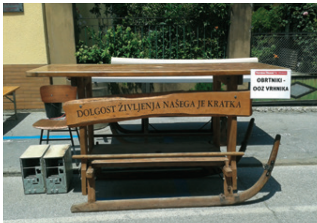
Stojnica OOOZ Vrhnika je pred akcijo kubarjev in obiskom lačnih Vrhnčanov samevala