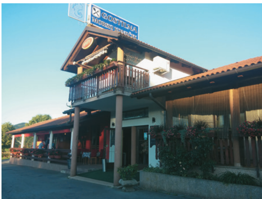
Gostilna Morski konjiček od zunaj

Ste odvisni od sezonskih gostov, ki poleti potujejo proti morju?