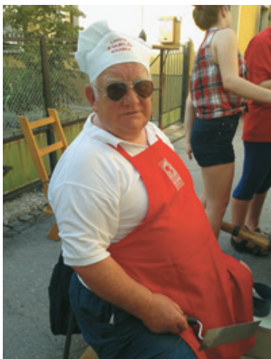
»Lakota je najboljša kuharica«, si je na kapo zapisal Dolfi