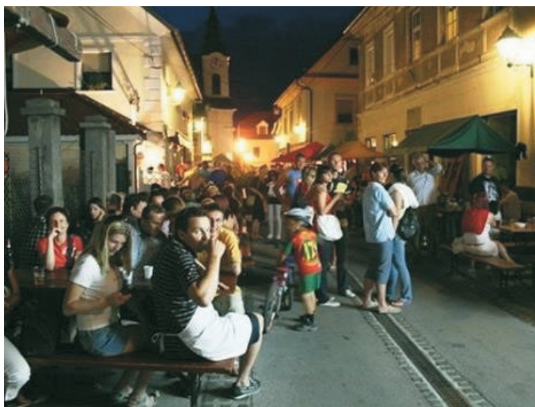
Stara cesta je bila v petkovi noči, 24. junija, poimenovani Dionizova noč, polna obiskovalcev, ki so okušali dobrote kuharskih ekip, si ogledali sejem domače in umetnostne obrti in zaplesali kar pred tremi odri.