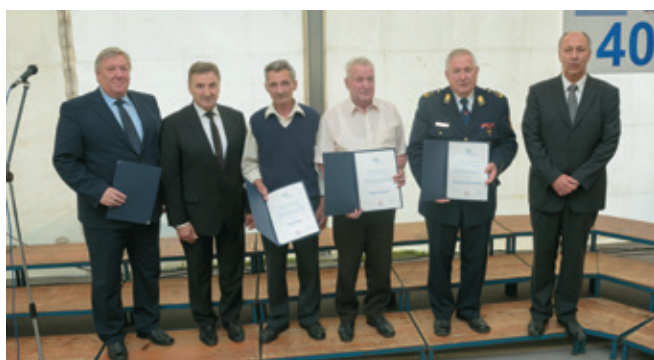
Prejemniki priznanj OOZ Logatec s predsednikom OOZ Logatec

OOZ Logatec se zahvaljuje vsem, ki so omogočili Teden obrti in podjetništva ter s tem tudi slavnostno prireditev ob 40. obletnici, najprej srebrnima sponzorjema zavarovalnici Adriatic Slovenica in NLB ter ostalim sponzorjem: Občini Logatec , Komunalnemu podjetju Logatec , podjetju Pivk Electric d.o.o. , vodi Mattoni in medijskemu sponzorju Radiu 94 .