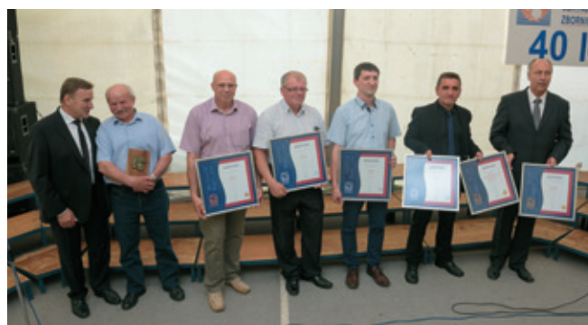
Prejemniki priznanj OZS s častnim članom OOZ Logatec in predsednikom OZS