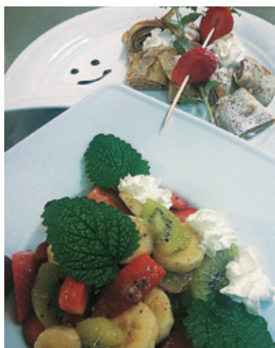
Vse slaščice pripravljajo v gostinski kuhinji

Poleg tega pripravljamo skupne akcije. Ena takih je pripravljena jedi s čemažem. Prvič je bila pri nas, odtlej se je selila in pristala v Avia pubu, kjer zdaj poteka vsako pomlad. Decembra se še enkrat skupno predstavimo, tema pa so koline. Vsakokrat v drugem gostinskem prostoru.