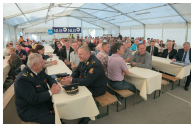
Veliko udeležencev na osrednji prireditvi ob 40-letnici OOO Logatec