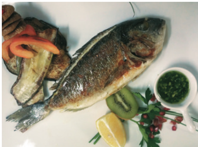
Ribe vselej na jedilniku Morskega konjička