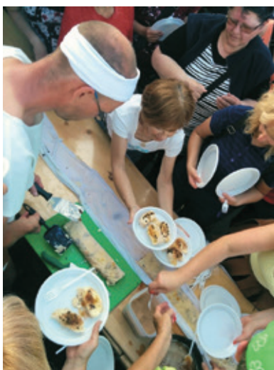
Vsi bi se radi sladkali z vrhniškim štrukljem

Popoldne se je prevesilo v večer in v Dionizovo noč, ko so se obiskovalci lahko zabavali in zaplesali ob treh odrih vzdolž Stare ceste. Za zabavo so poskrbeli ansambli Obvezna smer, duo Stare kosti in Ansambel Zajc.