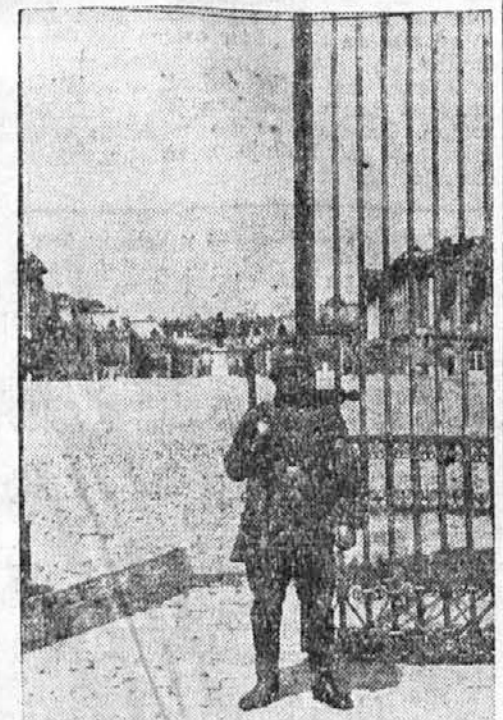
Nemška straža pred Versaillesom