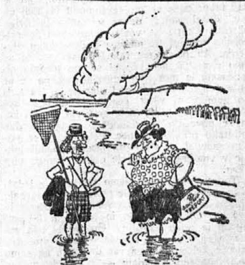
— Da, če človek ne pretirava, ni bolj zdravih reči, kot je takšna kopal v morju...

To vprašanje je zastavilo svojim čitateljem uredništvo nekega ameriškega dnevnika. Po odgovorih se vidi, da so se ideali zelo izpremenili. Ideal lepe ženske naših dedov je bil pri 20. letih. Zdaj smo se približali Balzacovi lepoti, ki je smatral žensko pri 30 letih za najlepšo. Menimo, da so žene pri 35 letih najzanimivejše, ker so šele tedaj v vsakem pogledu dorasle, v najlepšem cvetu svoje dobe. Tako je odgovorilo tudi 80.000 čitateljev. Več tisoč oseb je smatralo za najlepši tip ženske v starosti 24 let, 876 čitateljev je dalo prednost 18 letnim mladencam.