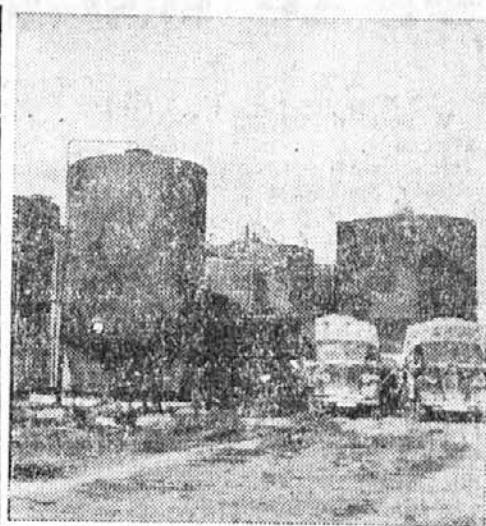
Nemčija je zaplenila v Franciji na milijone litrov petroleja. Iz velikih bencinskih cistern odvažajo avtomobili dragoceno gorivo na preskrbovališča