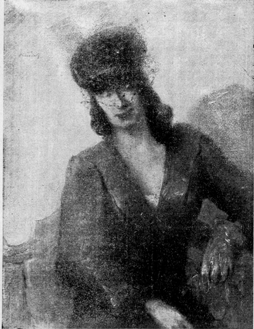
B. Debenjak: »Moja žena«, olje.

Danes se vsi ti umetniki vračajo. Vračajo se, da pozdravijo svojo rodno