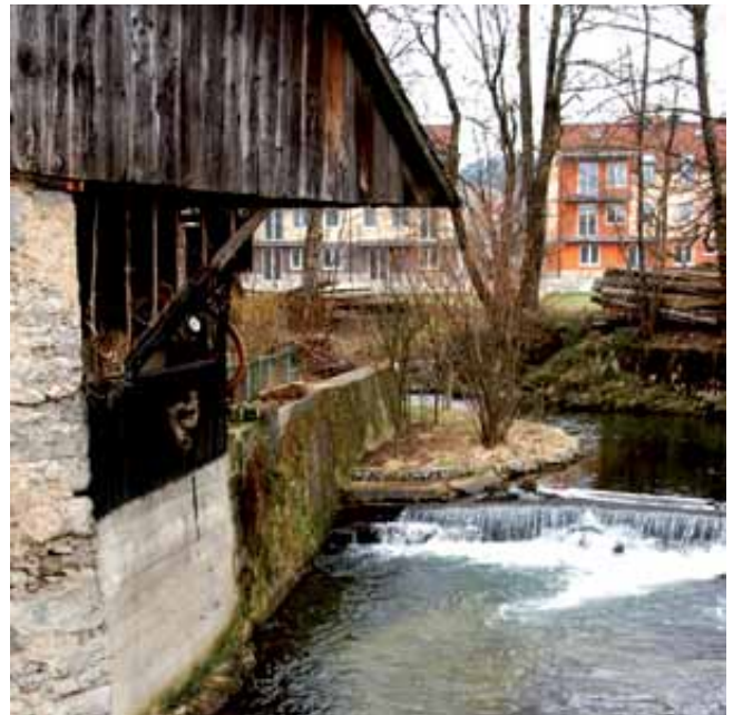
Struga potoka, kjer je nekoč stal trden Tršarjev jez.

V Logatcu so prvi vodovod z rezervoarjem zgradili leta 1898 na Naklu, v spomin nanj pa tudi vodnjak pred Škrljevo hišo v križišču Tržaške in Rovtarske ceste, ki obnovljen stoji sredi parka. Tudi Logaščica, ki je še pred leti poganjala vrsto vodnih koles, ki so gnala mline in žage, je v pomladanskem času videti dokaj čisto; v njej je kar nekaj rib. Nekateri pravijo, da so v njej opazili celo manjše rake, kar dokazuje, da je voda čista.