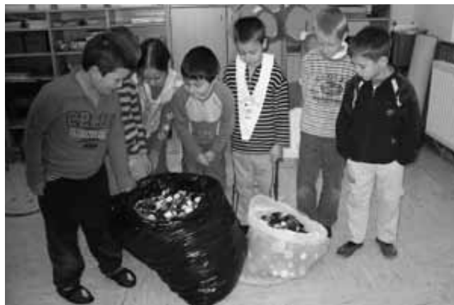
V Rovtarskih Žibršah so otroci zbrali cel kup zamaškov.