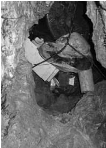
S smetmi so zatrpani tudi vhodi v kraška brezna.

Jamarji opozarjajo, da si z nevestnim početjem sami natikamo zanko okoli vratu, saj s tem onesnažujemo vodne vire. Ne gre pozabiti, da logaški kraški svet leži na območju podzemnega porečja Ljubljane, prav tako so potencialno ogrožene vodne vrtine in zajetja. Vodnim virom