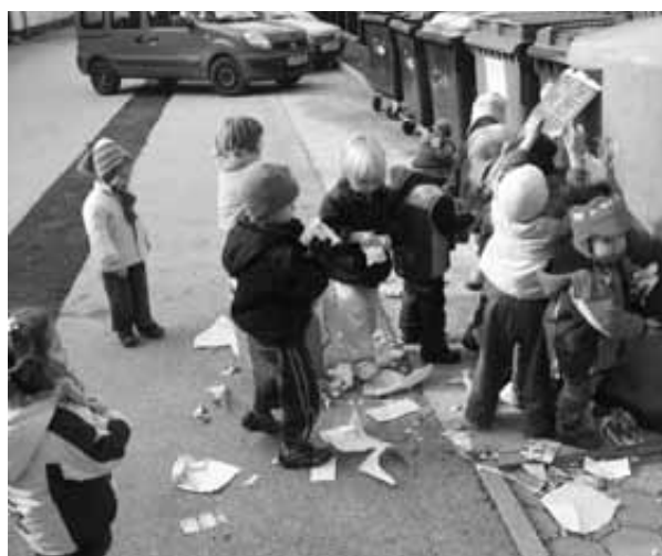
Ekološki otok ni navaden otok.

v službe.« Na vprašanje, kaj pijejo, ko so žejni, so takoj odgovorili, da vodo iz pipe. Vedo, da je ta vsaj v Logatcu dobra, boljša od tiste iz plastenke. Otroci so mi pokazali še recikliran papir, iz katerega so naredili čestitke za mamicе in žoge, iz praznih škatic pa vlak, avtomobile in druge igračke.