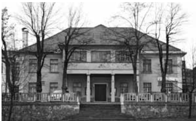
Sodelujoči na delavnici o logaškem kulturnem domu so se strinjali, da naj Narodni dom ostane kulturno središče.