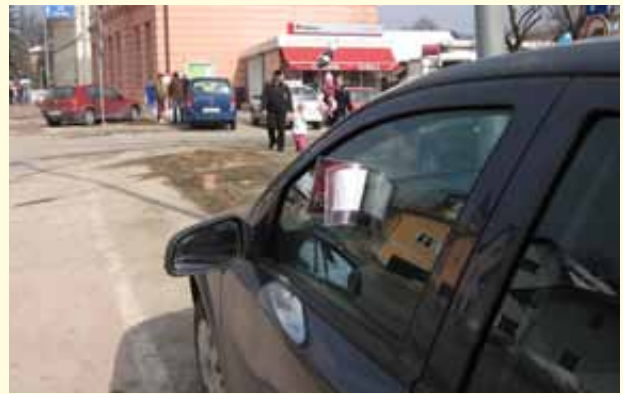
Pretirano natančna globa.

Imamo medobčinski inšpektorat, ki bdi nad napačnimi ravnanji, s katerimi se kršijo določbe odloka o javnem redu in miru. Tako je prav. Toda. Bo kar prav, da se inšpektorji izogibajo pretirane natančnosti, ki ne sledi izjemnim okoliščinam, kakršne življenje vendarle kdaj pa kdaj tudi ponudi. V takih okoliščinah bi ne bilo odveč, ko bi poleg odloka upoštevali tudi kako zrno soli. Letošnji Gregorjev semenj je ob lepem sončnem vremenu obiskalo veliko ljudi od blizu in daleč. Dan današnji se na tovrstne prireditve ljudje, zlasti oni od daleč, pripeljejo z avtomobili. Tako se je primerilo tudi ob letošnjem sejmu. Logatec je bil prav zaradi obilnega obiska zatrpan z avtomobili; parkirišča so bila prepolna. In ta in oni voznik je v tej zadregi parkiral zunaj dovoljenega, pa ne da bi posebej motil prometne in peštokove. A inšpektorji – služba tudi iz občine Logatec – so lepili globe. Dovolj premišljeno? Z dovolj soli? Bodo ljudje še prihajali na Gregorjev semenj, če jim bomo tako neljubezni gostitelji? Spričo tako pretirane natančnosti naših inšpektorjev najbrž ne.