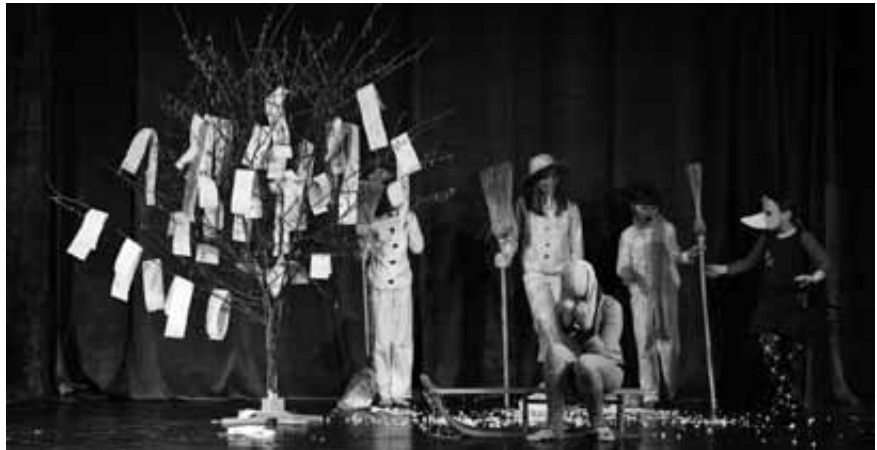
V eni od predstav na gledališko-lutkovnem maratonu obupani zajček s pomočjo drugih živali ni in ni mogel pregnati pomladi.