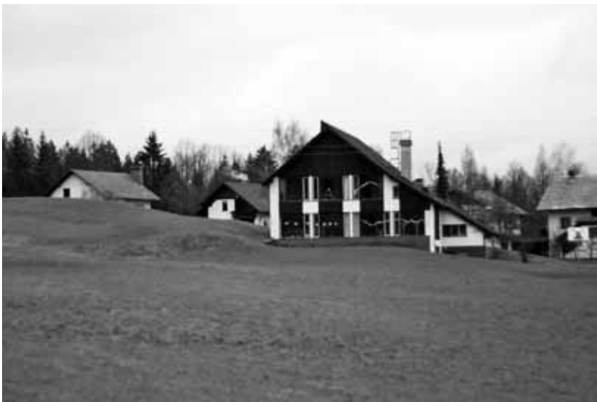
Kje ob šoli bo zrasel športni park?