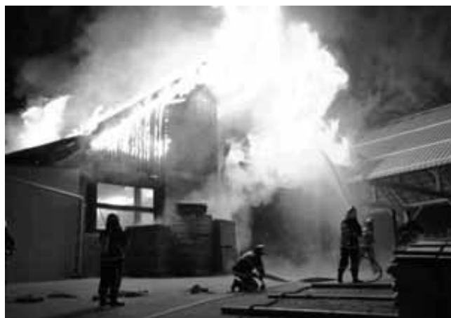
Dolnjelogaški gasilci so imeli lani veliko dela.