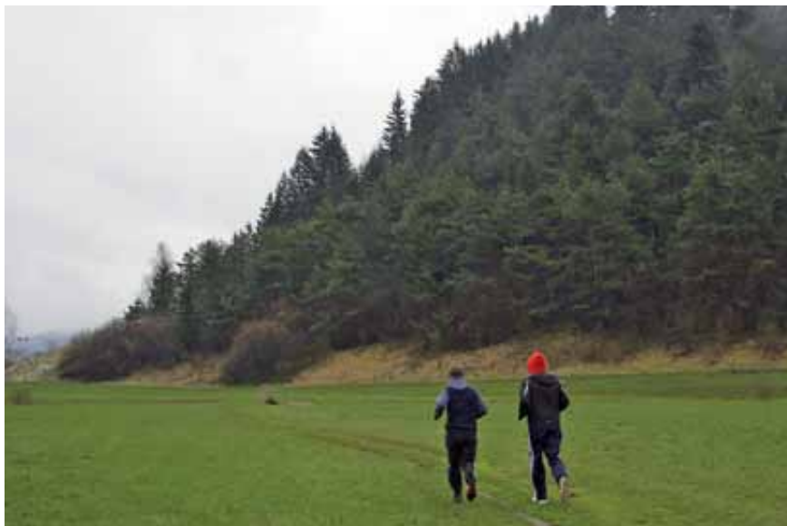
Rekreacijska pot pod Sekirico je popularna, v prihodnje bo zato ob njej več košev za odpadke.

Naredili bomo sortirnico, verjetno za potrebe celotne Notranjske, kjer bi iz »črnih« posod lahko izločili še 25 odstotkov odpadkov in dosegli 75 odstotkov ločeno zbranih frakcij, ostanek pa odlagali. Tako bi izločili kovine, les in ostanke plastike. Dobili bi t. im. lahko frakcijo, ki lahko gre