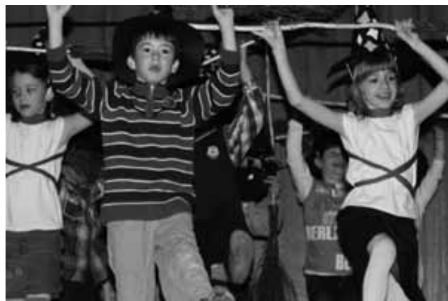
Mamicam so zaplesali male čaravnice in čarovniki iz prvega razreda.

Kako zahteven je angleški valček, so izkusili drugošolci, hip-hop pa je tako ali tako mladostniška domena, pri plesnem krožku so naštudirali Piko Nogavičko in Pusti soncu. Najbolj so navdušile čaravnice in čarovniki iz prvega razreda s čisto praviimi metlami in klobuki. Vrtničarji pa tako ali tako požanjejo največji aplavz, če se le opogumijo in pridejo na oder. Bilo je še veliko recitatorjev in recitatorjk, ki so se strinjali, da so lahko zelo srečni, da imajo očke, mamice, dedke in babice. Da, tudi na očke in dedke nismo pozabili, kajti šele z njimi žene postanejo mamice in babice. Pomen besede hvala smo lahko videli v zaigranem prizorčku o Hvaležnem medvedu. Mnogim staršem, še posebej mamicam, so ob pogledu in poslušanju svojega sina ali hčerke