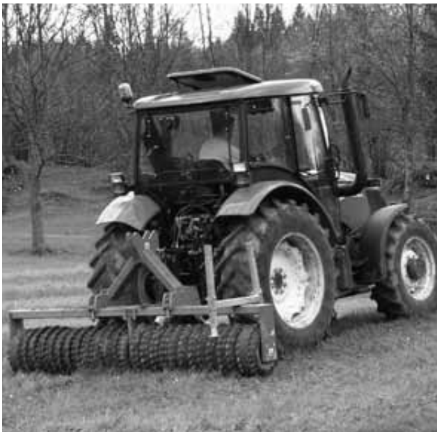
Z valjanjem pritisnemo od zmrzali dvignjeno travno rušo ob tla, da rastline hitreje dobijo stik z zemljo in hranilnimi snovmi, poravnamo pa tudi kratine.

Ko se tla primerno osušijo, je treba poskrbeti, da bodo rastline v travni ruši dobile vse potrebno za novo rast. Prva spomladanska opravila na travnikih in pašnikih so tako čiščenje in branjanje ali valjanje travne ruše. Omenjeni agrotehnični ukrepi so za zagotavljanje visokega pridelka kakovostne krme nujni, kajti mlade rastline potrebujejo za hitro rast in dobro razraščanje optimalne rastne pogoje. Z odstranitvijo ostankov stare rasti in drugega onesnaženja dosežemo boljše zračenje in rastlinam dovedemo potrebno svetlobo in toploto. Odvisno od načina in intenzitete rabe, nato travno rušo še pognojimo