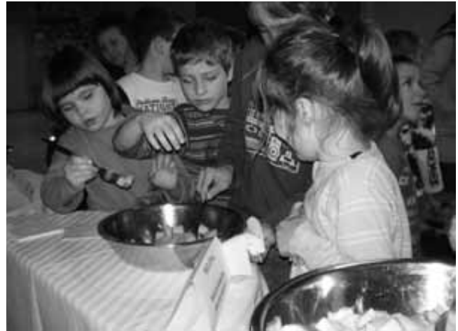
Mmmm ... daj še meni malo melone.

17. aprila smo se priključili akciji Očistimo Slovenijo v enem dnevu. Učenci so en dan pouka namenili ekološkemu ozaveščanju. Z dejavnostmi, kot so izdelovanje lutk iz odpadnega mate-