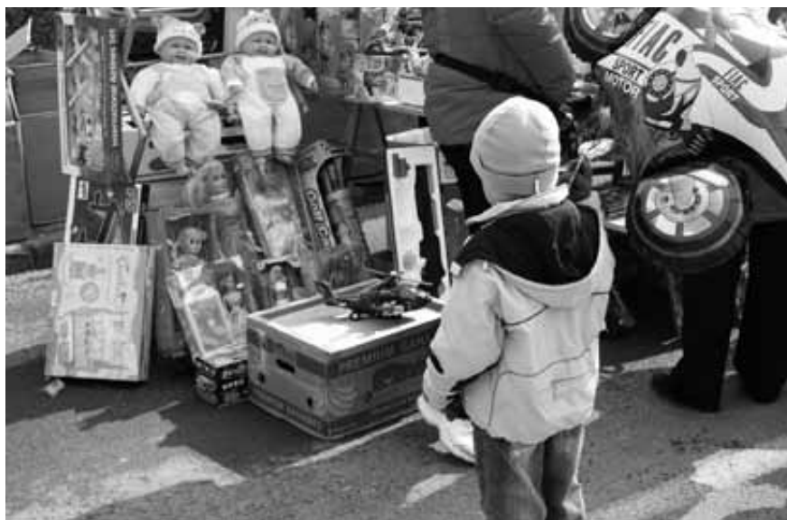
Bolj kot semena in izdelki domače obrti so otroške oči pritegnile plastične igrače, pisani baloni in nepogrešljiva sladkorna pena.

Letošnji Gregorjev sejem je le dan po Gregorjevem, 13. marca, v Logatec privabil množico obiskovalcev od blizu in daleč. Na občini si prizadevajo, da bi na sejem vsako leto privabili čim več ponudnikov izdelkov domače obrti, pridelovalcev domače zelenjave, sadja in medu ter branjev in prodajalcev semen in dreves. Poleg njih so tudi letos na Cankarjevi ulici svoj prostor med drugimi dobili člani društva za zdravilne rastline Ognjič, ki so ponujali čaje in druge zdravilne pripravke, pa tudi podeželska dekleta in žene, ki so ponujale kruh iz krušne peči, slastne potice in gregorjeve ptičke. Kljub temu pa glavniino sejemske ponudbe poleg njih in ribniških suhorobarjev še vedno predstavljajo prodajalci takih in drugačnih oblaci in plastičnih igrač, ki gredo prav tako ali celo še bolje v promet. Kot da nimamo doma omar, polnih stvari, na katerih se nabira prah.