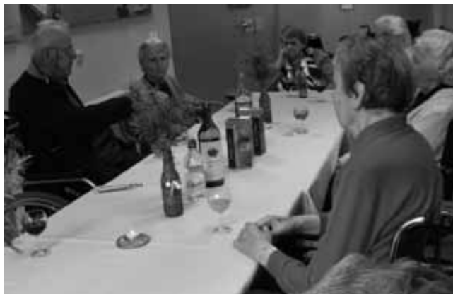
V domu starejših ni nikomur dolgčas.

Kot vsako leto smo tudi letos delali butare. Delali smo jih v vsakem nadstropju, naredili smo tudi butaro velikanko. Material