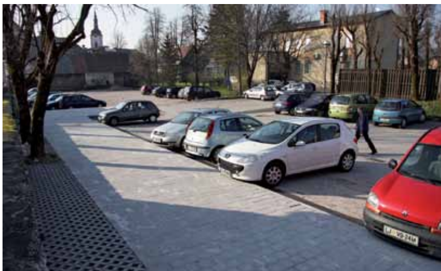
Prostor za tržnico na parkirišču pri Krpanu v Dolnjem Logatcu je že tlakovan. Obratovati bo začela maja, in sicer od ponedeljka do petka med 7. in 19. uro, pozimi med 8. in 17. uro, ob sobotah pa med 7. in 14. uro.

Maja naj bi ob robu parkirišča med Krpanom in nekdanjo občinsko stavbo odprli novo tržnico, na kateri bodo lahko poleg živil prodajali predvsem cvetje, semena, sadike in izdelke domače obrti, le občasno in s posebnim dovoljenjem komunalnega podjetja kot upravljalca pa tudi galanterijo in oblačila. »Tržnica ni namenjena prodaji izdelkov, ki jih imajo na rednem mesečnem sejmu, ki ostaja na Cankarjevi cesti, pač pa želimo okoliškimi pridelovalcem dati možnost prodaje lastnih pridelkov in izdelkov