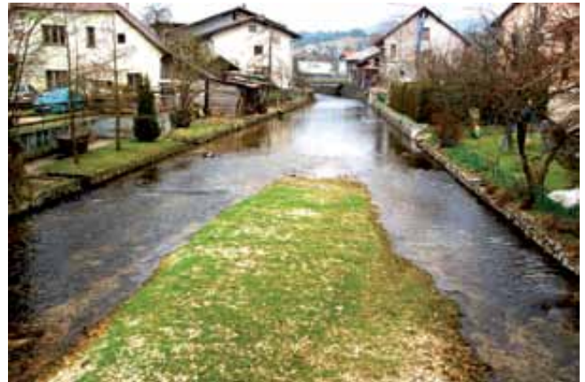
Pogled na Logaščico z mosta na Brodu.