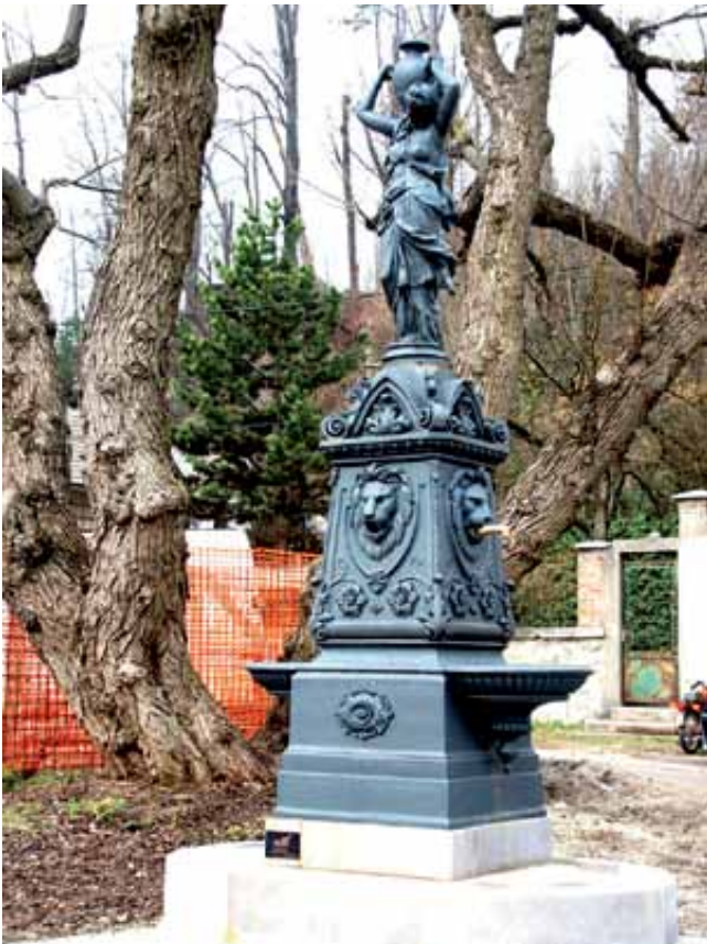
Obnovljeni vodnjak ob Tržaški cesti je bil zgrajen v spomin na odprtje logaškega vodovoda.