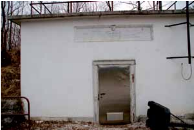
Prvi vodovodni zbiralnik za logaški vodovod na Naklu so zgradili v času vladavine Franca Jožefa leta 1898.

Ob 22. marcu, svetovnem dnevu voda, se moramo zamisliti tudi ob usihanju in onesnaževanju vode, ki sta posledica segrevanja zemlje in njenega onesnaževanja s pesticidi in gnojili. V državah v razvoju vzrok za različne bolezni v kar 80 odstotkih pripisujejo onesnaženi vodi. Slovenija je sicer z vodo bogata država, pravimo, da imamo čisto vodo, vendar smo podtalnico ponekod že precej onesnažili s pesticidi, predvsem v Prekmurju. V logaški občini še lahko brez skrbi pijemo vodo iz vodovodnega omrežja, v katerega je vključenih enajst zbiralnikov, rezervoarjev, in štirinajst črpališč, in jih oskrbuje šest delavcev komunalnega podjetja.