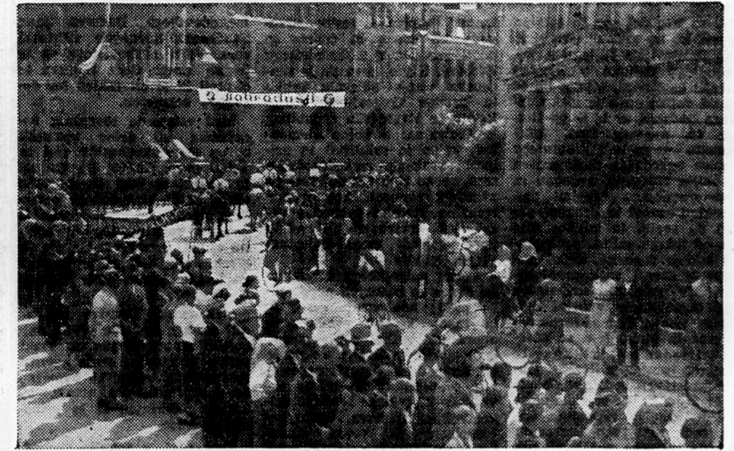
Slika z zleta »Svobode« leta 1935 v Celju

V nedeljo, 24. avgusta bo glavni izletniški dan. Vsa Slovenija bo zbrana v Trbovljah. Delavci iz vseh naših krajev bodo prišli, eni, da pokažejo, drugi, da vidijo, kako se razvija naša delavska kultura. Zjutraj bo sprejem gostov na železniški postaji, nato se bo razvila povorka s kolodvora na zletniški prostor — stadion Rudarja. Po slavnostnih govorih bo nastopil moški pevski zbor slovenskih rojakov iz Francije, nato pa združeni moški in mešani pevski zbori ter godbe iz vse Slovenije. Popoldne bo velik fizikturni nastop, nato pa ljudsko rajanje.