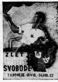
Trbovlje, zadnje dni julija

General Nagib je sinoči izjavil da se bodo vojaške enote dale umaknile s ulic Kaira in Aleksandrije in da bodo varnost države poverili vladi. To izjavo je dal po tri ure trajajočem posvetovanju s predsednikom vlade Ali Maherjem.