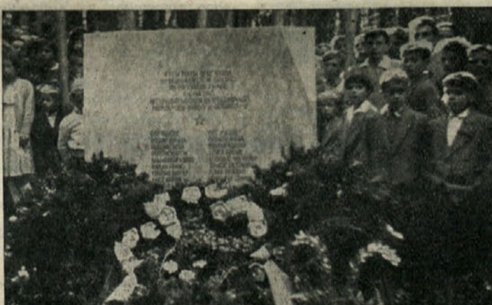
V Smrečju pri Turjaku, kjer je »črna roka« umorila 26 ljudi, so postavili spominsko ploščo z imeni ubitih

V Andrijevici je predsednika Tita pozdravilo kakih 5000 prebivalcev mesteca in okoljskih krajev. Ko je prišel v Ivangrad mu je kakih 20.000 prebivalcev priredilo navdušen sprejem. Po ulicah, ki so bile polne cvetja, skozi gost špalir radostnih prebivalcev Ivangrada in okoljskih krajev, se je peljal predsednik Tito skupaj s predsednikom Ljudske skupščine Črne gore Blažom Jovanovičem. Tudi v Bišelem polju je predsednika republike Tita pozdravilo ob sprejemu nad 20 tisoč prebivalcev. Priredili so mu navdušen sprejem. Po 6 dnevem obisku se je predsednik Tito poslovil od Plevlja in Črne gore.