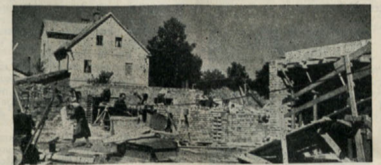
Gradnja vajejnškega doma

Po velikih naporih za ureditev in izgradnjo mesta Kočevja v dneh ob 10. obletnici zasedanja Slovenskega narodno osvobodilnega sveta, ko so mnogi prebivalci z navdušenjem sodelovali v izgradnji mesta, so sledila leta, ko je vsa skrb za ureditev mesta in izgradnjo ter napredke gospodarstva ležala izključno na ljudskem odboru in gospodarskih organizacijah. Kljub temu, da se je tudi v zadnjih letih v Kočevju precej zgradilo in uredilo, moramo reči, da naše mesto v tempu razvoja le zaostaja za razvojem številnih drugih slovenskih mest. Ko je občinski odbor Socialistične zveze razpravljal o tem položaju, je prišel do zaključka, da je treba odločnejše pristopiti k zunanji ureditvi mesta in da je treba skrbneje razporejati in izkoristiti sredstva, ki jih imamo na razpolago.