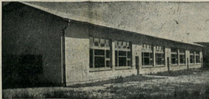
Nova šola v Dolenji vasi je ena najlepših šol