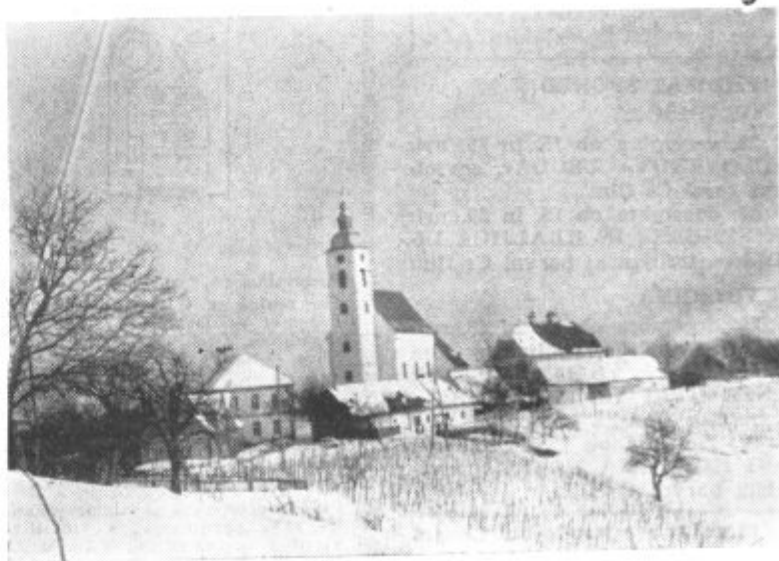
Zgornja Ščavnica v zimski obleki

ditev kulturnega doma v Zg. Ščavnici. Na tak način bi se lepo oddolžili vsem tistim, ki so letos darovali za dom les, denar in prostovoljno delali ter seveda vsem občanom na Ščavnici. Ob tem je tudi potrebno upoštevati, da so volilci za kulturo in šolstvo na Ščavnici namenili več kot polovico vseh sredstev iz krajevnega samoprispevka.