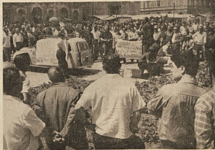
Pretekli teden je bila vsedrjavna stavka pristaniških delavcev. Stavka je tudi v Trstu popolnoma uspela. Jugoslovanski pristanišniki so sklenili, da ne bodo raztovarjali blaga iz ladij, ki bi jih preusmerili v njihova pristanišča. (Na sliki zborovanje stavkajočih v Trstu)