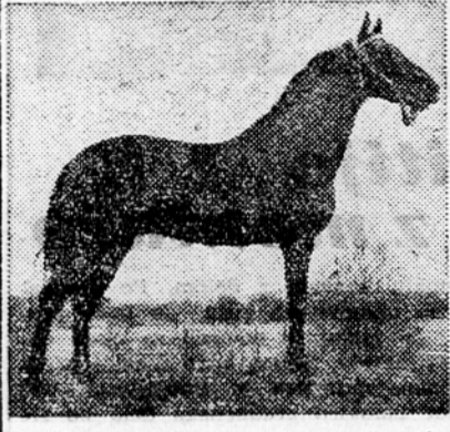
Prizor s prvih letošnjih kasaskih dirk v Turnišču

in spomialdanskega treninga. Spored je obsegal 10 točk, ki so se hitro odvijale za drugo.