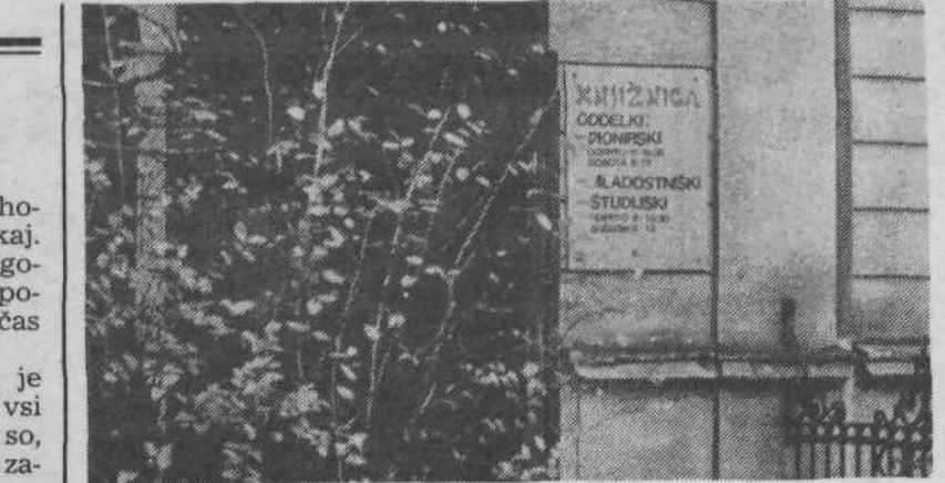
PRODORNO DELO PIONIRSKE KNJIŽNICE

Našim šolarjem želimo vedre, vesele in sproščene počitniške dni!