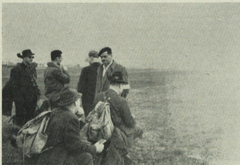
Spomladanska vzrejna preskušnja 1960 na Ljubljanskem polju. Sodniki ocenjujejo delo psov

Povprečje uspehov je prav zadovoljivo, saj je bilo 9 prvih ocen, 4 druge in 3 tretje ocene. Ocene prvo plasiranih so tesno druga ob drugi, da je bilo kar težko do- ločati zaporedje.