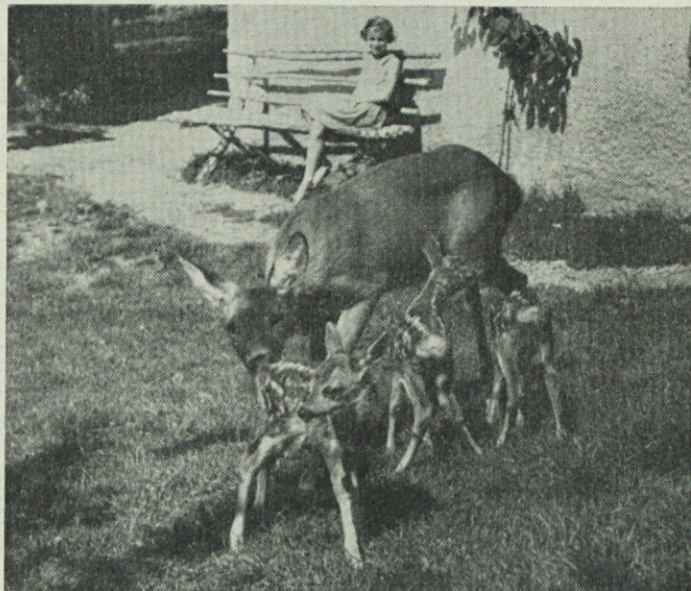
Pikica s svojimi mladiči — 1958