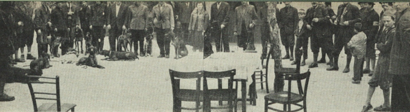
Ocenjevanje psov pred spomladansko vzrejno preskušnjo 1960