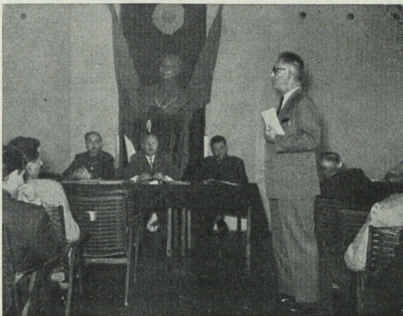
Z občnega zbora LZ Celje 28. V. 1960

Stalež srnjadi, ki je precej normalen, se kvalitetno stalno dviga, kar pričajo trofeje. Točke ocene so se dvignile od povprečnih 87,91 v letu 1957, na 101,20 v letu 1959. Tudi stalež ostale divjadi se razveseljivo dviga, kar kaže odstrel, ki se je n. pr. pri fazanih od 1956. do 1959. dvignil za 711 %. Družine so položile čez 10 000 zastrupljenih jajc in uspeh je bil odličen. Pokončanih je bilo vsega 12 218 škodljivcev. V tem letu je bilo po družinah 66 predavanj in se je udeležba članstva dvignila za 121 %. Lovski strelski šport se med članstvom razveseljivo razvija in je bilo v tem letu 28 strelskih tekmovanj, s skupno udeležbo 5000 članov. Lovskih psov imajo družine 493; kinoloških prireditev je bilo 9. Na pobudo zveze je ObLO imenoval 9-članski potrošniški svet lovcev in ribičev, ki je trgovino Jelen v kratkem tako konsolidiral, da zadovoljuje z blagom in priborom lovce in ribiče. To je prvi aktivni potrošniški svet te stroke v okrajnem in državnem merilu. Zveza ima 50 lovskih družin in je za intenzivnejše delo in za strokovno pomoč ter za medsebojno povezavo in obveščanje, organizirala sektorske starešinske posvete in posebej še pomladanski starešinski posvet. Občni zbor je med drugim sklenil: 1. da se pri trgovini Jelen organizira prodaja divjadi in uredi servisna delavnica za popravilo lovskega orožja, 2. da naj oblast zaradi pobijanja ptic pevk z zračnimi puškami, omeji streljanje na strelišča in