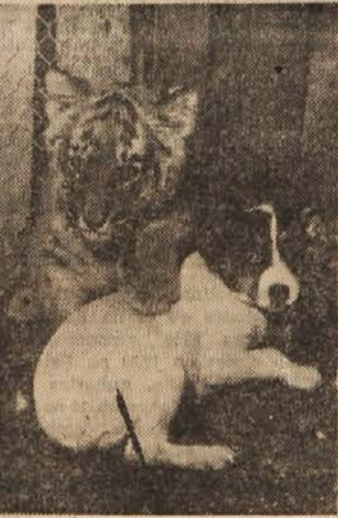
Psica pasme terrier je postala skrbna mati mlademu tigru. V zoološkem vrtu v Kopenhagnu je namreč obolel mladi tiger. Morali so ga operirati, toda ko so ga vrnili njegovi pravi materi, ga ni več marala. Potem so ga dali mačehi. Na sliki vidimo, da sta se mačeha in njen »sin« tigr spoprijateljila

Zahodnonemška vlada je počastila spomin pesnika Schillerja ob 150-letnici njegove smrti tako, da je naročila kovnici, naj izdelava večjo količino kovancev po 5 mark, ki bodo poleg dosedanjih kovancev enake vrednosti odslej v prometu kot zakonito plačilno sredstvo.