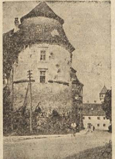
Stolp brežiškega muzeja, kjer ima prostore tudi Posavski muzej

Teden muzejev, ki se je začel v nedeljo, je letos posvečen spomenikom narodnoosvobodilne vojne in je tako združen s števil-