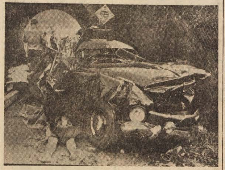
Pri Mühlheimu v Nemčiji se je pred dnevi pripetila avtomobilska nesreča, v kateri je izgubila življenje vsa družina, ki se je odpeljala na nedeljski izlet. Zapornice so bile namreč po pomoči odprte. Avtomobil je zapeljal na progo, vitem pa je pridrvel osebni vlak. Kaj se je zgodilo, vidite na sliki

kapitala. Kdor je vedel, kako spraviti rudo do reke St. Lawrence, 600 km dalje proti jugu, je lahko upal na dober zaslužek. Kanadci so našli železno rudo, izkoriščati pa so jo začeli Američani. Pet največjih ameriških družb jeklarske industrije je dalo 82% kapitala. Takoj so napravili načrte za zgraditev železniške proge med jezerom Knob in reko St. Lawrence. Seven Islands naj bi postal veliko središče za prekladanje železne rude z avtomatičnimi nakladalnimi in sortirnimi stroji. Zgradili naj bi tudi dva jezera, da bi imeli na razpolago električno energijo. Vse to delo je spominjalo na invazijo. Najprej izkrcanje v Seven Islandsu, potem pa prodiranje. Graditev železnice je bila zelo težavna, saj je bilo treba med drugim premostiti 650 m visoko kotlino. Železnico so gradili ob reki. S hidroplani so morali prevažati delavce in gradivo daleč v zaledje, kjer so zgradili več zasilnih letališč. Naposled so ljudje in stroji svoje delo opravili. Gradbeni stro-