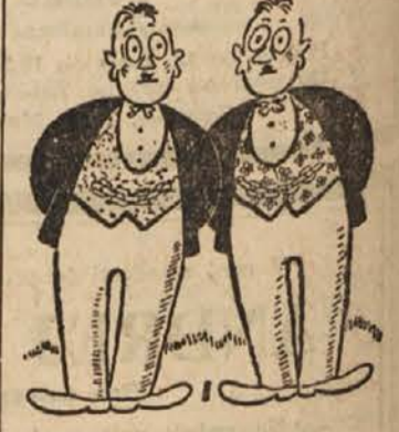
»Pravijo, da imaš dolgove.« »Neumnost! To so samo prazne govornice, ki jih širijo moji upniki.«