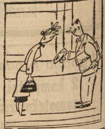
»Res, gospodična, komaj sem vas znova spoznal, tako ste se spremenili.« »Na boljše ali na slabše?« »Le kako morete kaj takšnega vprašati? Vi se lahko spremenite samo na boljše.«