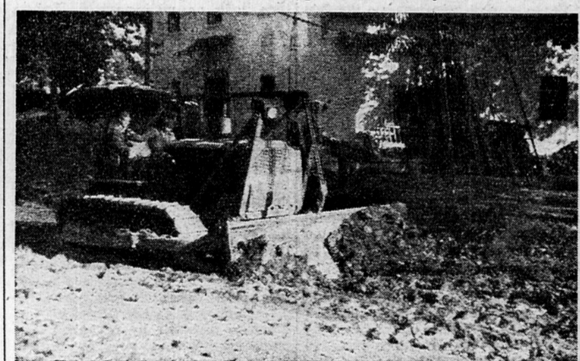
Orjaški stroj pomaga ljudem pri napornem delu