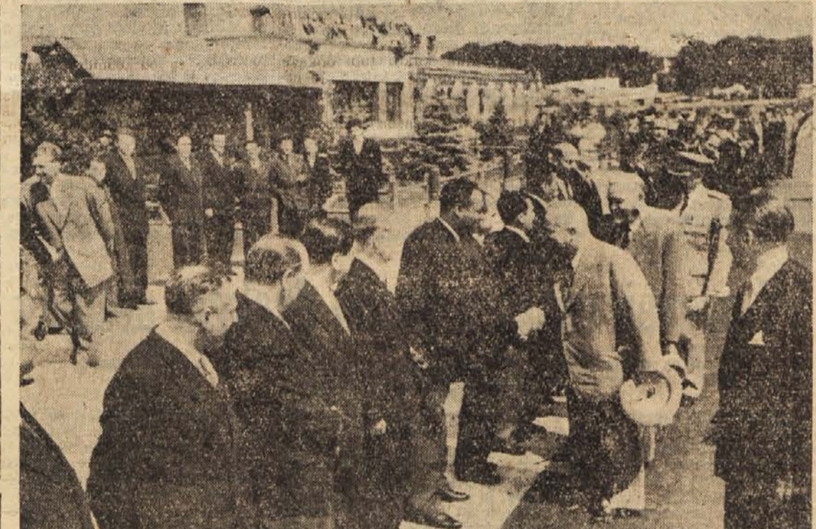
Slavo sovjetskih državnikov od predstavnikov diplomatskega zbora na beograjskem letališču

Na mitingu je govoril tudi bolgarski ministriški predsednik Viko Cervenkov. Med drugim je rekel, da pomenijo beograjski razgovori in deklaracija vlad ZSSR in FLRJ uspešen prispevek k stvari miru.