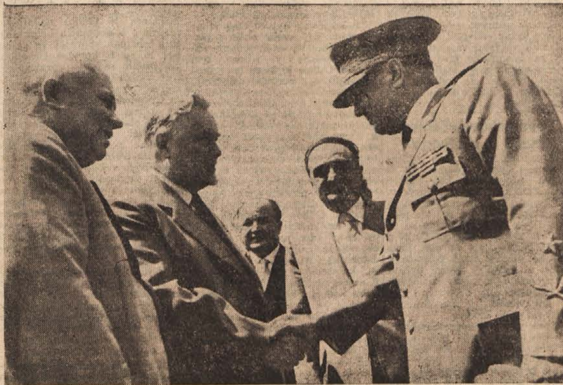
Predsednik republike Tito in predsednik vlade ZSSR Bulganin se rokujeta ob odhodu sovjetske državne delegacije iz Beograda

Na sprejemu je nastopila skupina sovjetskih umetnikov. Spored je bil zelo bogat in raznovrsten. Gostje so z dolgotrajnim ploskanjem pozdravili vsako točko.