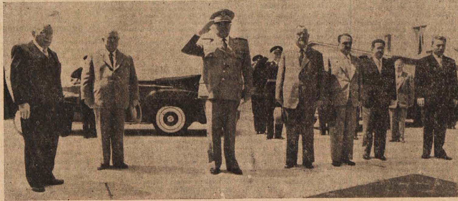
Med izranjem himne na beograjskem letališču ob odhodu sovjetskih gostov iz naše države