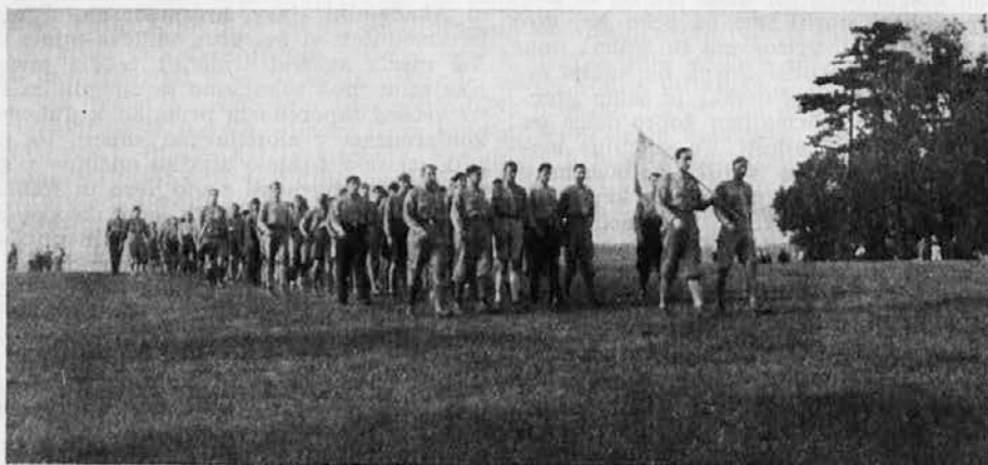
Četa dunajskih kongreganistov na izletu

Danes zjutraj smo poslušale besede dr. M. Opeke, v duhu smo prosile z njim vred Marijo: »Skozi viharje hrumeče življenja nas pelji k Očetu domov.« Skupno smo se nato znova posvetile svoji Gospe, Zavetnici in Materi in pristopile med sv. mašo k mizi Gospodovi. Kruh močnih nas je potrdil v vseh naših sklepih. Ob 11 dopoldne pa se je