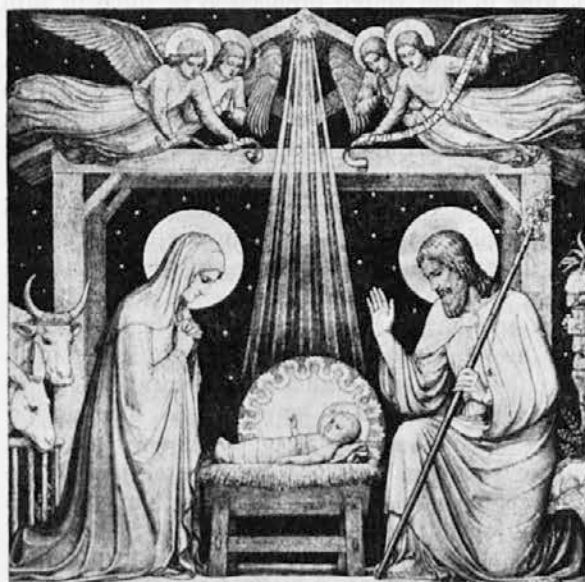
Beuron: Gospodovo rojstvo