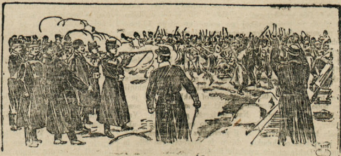
Kmečki upori v Rumuniji: Vojaštvo strelja na upornike.

Kmečki upori v Rumuniji so minuli. S kroglijami in s sabljami je potlačila vlada uporne kmete. Vodje upora pa sedaj lovijo po deželi in jih zapirajo. Vendar te žrtve niso bile zastoj, kajti vlada je obljubila, da bo skrbela za pravične pogodbe med kmeti in veleposestniki. Rumunija je ena najplodovitejših dežel kar se tiče žita in vendar so kmetje stradali, med tem ko so si mogočneži polnili žepi z milijoni. Upamo, da prelita kri ni bila zastoj in da pridejo za naše rumunske brate boljše časi.