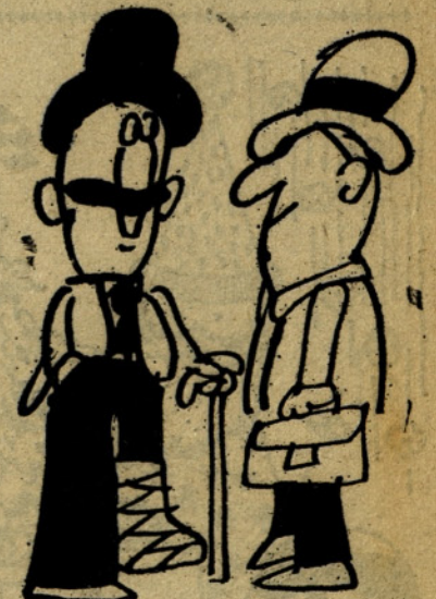
Z avtom se marsikaj spozna. Jaz poznam celjsko, mariborsko in kopersko bolnišnico. (Pavliha)

1. nagrada 200,00, dve nagrade po 100,00 in pet nagrad po 50,00 din. Rešitve pošljite na uredništvo do 15. 1. 1977.