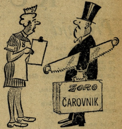
Vaš pomočnik leži v sobah 11 in 12. (KIH)