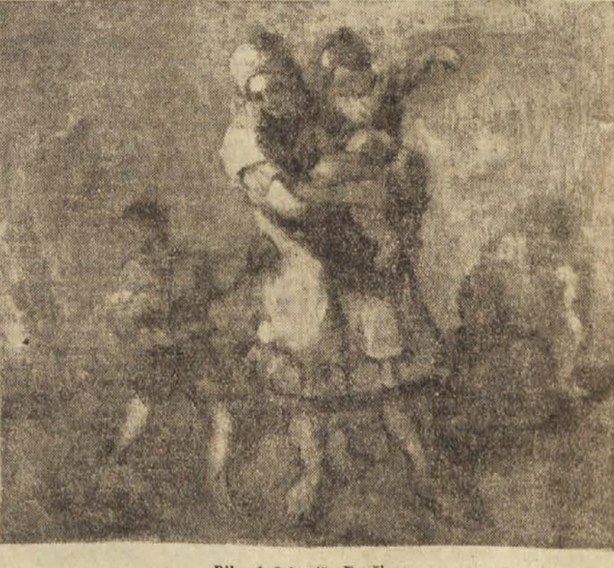
Rihard Jakopič: Družina, ena izmed številnih študij za fresko v veži mestne hiše na Abačjevji cesti.

Čeprav pristevamo Moderno galerijo med našo najmlajše kulturne institucije, je v svojih prostorih priredila že celo vrsto priložnostnih ter zlasti retrospektivnih razstav naših sodobnih upodabljajočih umetnikov. Vendar pa do sedaj svoje glavne naloge, to je postavitev stalne galerijske zbirke, zaradi tehničnih težkoč ni mogla uresničiti. Zato je tem bolj treba pozdraviti dejstvo, da so vse predpriprave v polnem teku ter da bo že letos spomladi zbirka urejena ter dostopna javnosti. Zbirka, ki naj poudari prežet razvoj naše moderne umetnosti, bo vključevala tudi nekatera značilna kasnejša dela naših impresionistov, kot tisti temeljni kamen, na katerem je zrastle zgradba naše sodobne umetnosti.