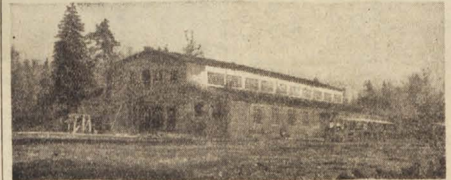
Objekt Elme za Savo pri Črnučah. Komaj tretjino so končali z gradbenimi deli, pa že eno leto teče proizvodnja