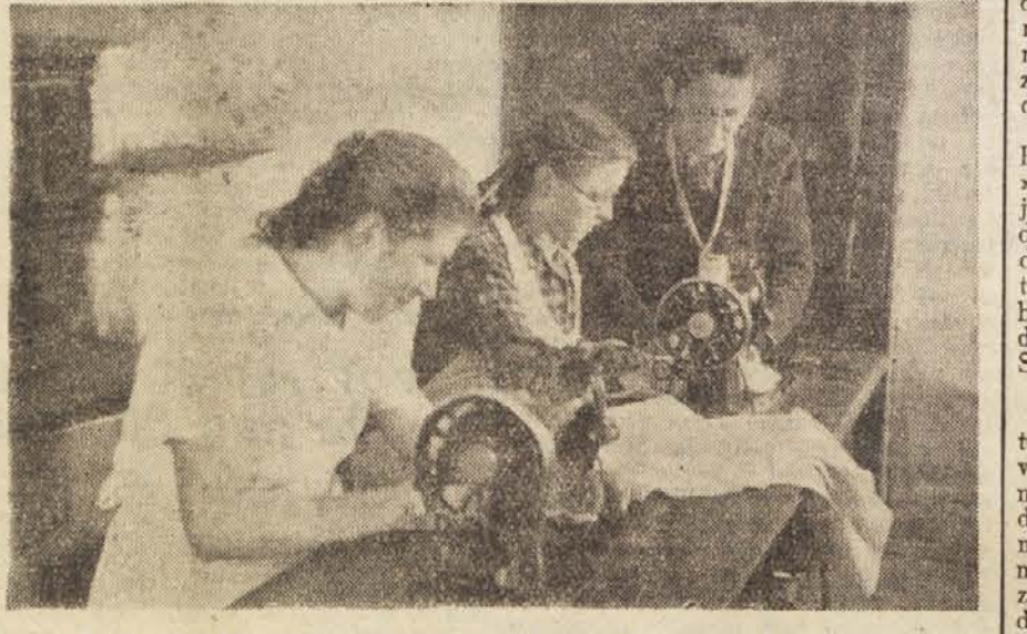
Izobraževalni tečaj v Boltiji nad Litijo. Dekleta pri šivanju

Sedaj ko so videli uspehe Boltijcev, so se začeli tudi drugod zanimati za tečaj. S Svete gore so že prišli vprašati na Boltijo, kam se je treba obrniti, da bi tečaj začeli... Tudi v Savi, Litiji in Vačah se jih loteva navdušenje.