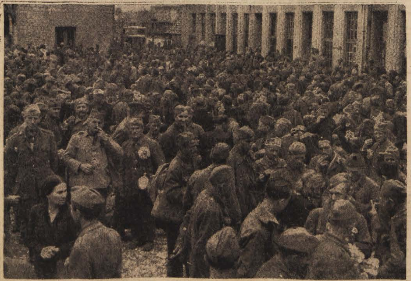
Ljubljansko prebivalstvo se je prisrčno poslovilo od srbskih, črnogorskih in bosanskih borcev, ki odhajajo domov iz edinic IV. armade