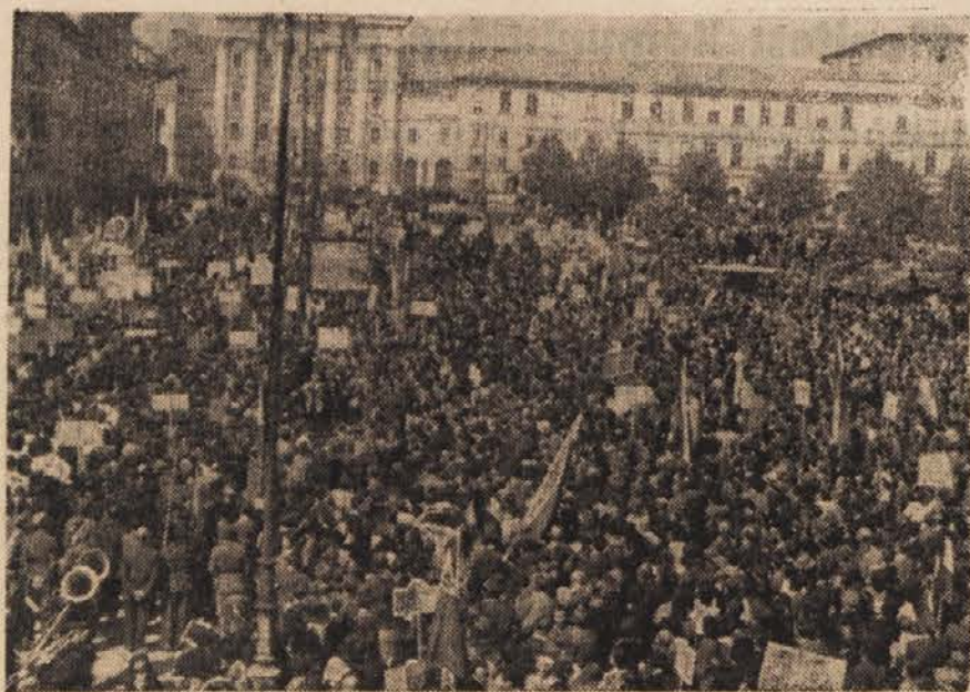
Petdeset tisoč glava množica na manifestacijskem zborovanju v Ljubljani.