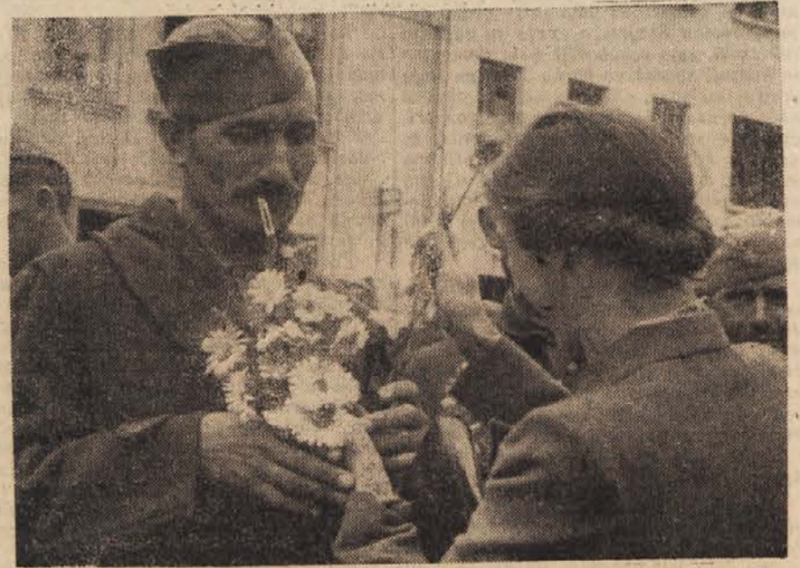
Slovenska žena pripenja šopek demobiliziranemu borcu

O tem si ne delajo skrbi. Nikoli niso mislile nase, vsako uro so bile pripravljene žrtvovati življenje za svoj narod in tovariše. Partizan je vedno zagrabil tam, kjer je bilo treba. Za njega ni »boljših